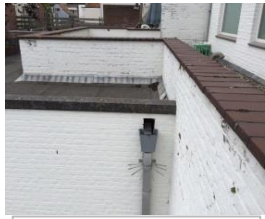
HWA aansluiten op bestaande HWA