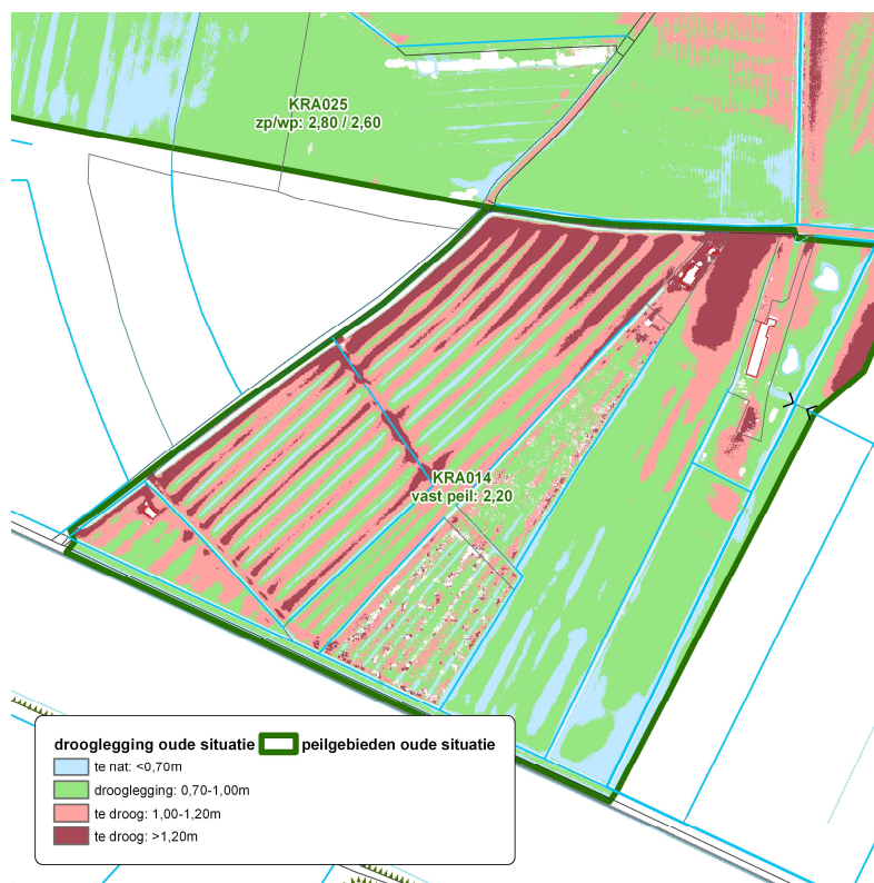
Afbeelding 1: droogleggingskaart oude situatie bij een winterpeil van NAP 2,60