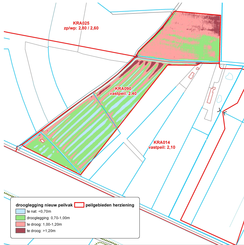
Afbeelding 2: droogleggingskaart nieuwe situatie bij een vastpeil van NAP 2,40