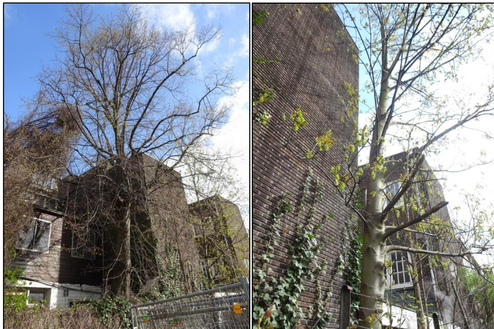
Afbeelding 2 & 3: Boomnummer 1 (links) en 2 (rechts).