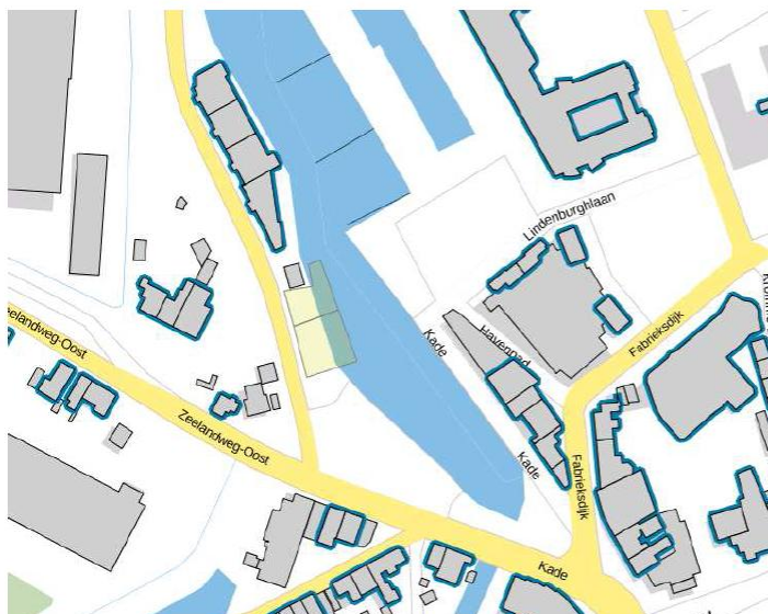
Figuur 1 weergave geluidgevoelige bestemmingen (donderblauw omkaderd) op basis van de BAG-viewer van het kadaster.

In de berekening van uw adviseur zijn verschillende immissiepunten gegeven. Op grond van de BAG-viewer (zie onderstaande figuur) wordt geconcludeerd dat de immissiepunten A en D niet ter plaatse van een geluidgevoelige bestemming zijn gelegen.