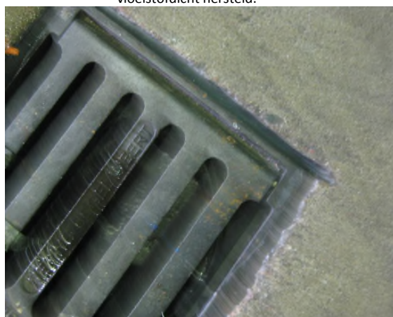
Fotonummer: 6 Omschrijving: Voegen rondom kolk vloeistofdicht hersteld.