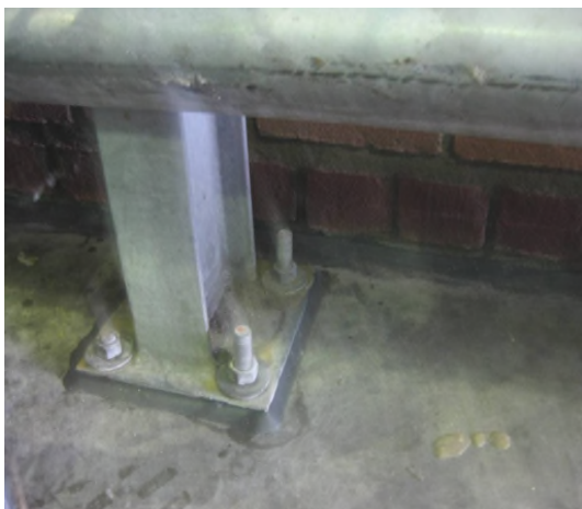
Fotonummer: 1 Omschrijving: Voetplaten en aansluiting randmuur zijn vloeistofdicht afgewerkt.