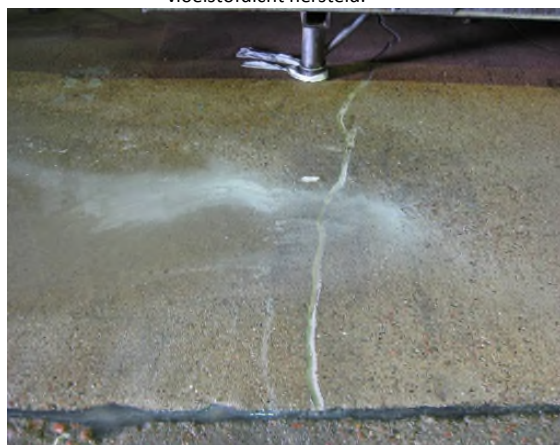
Fotonummer: 4 Omschrijving: Scheurvorming onder spoelbak is vloeistofdicht hersteld.