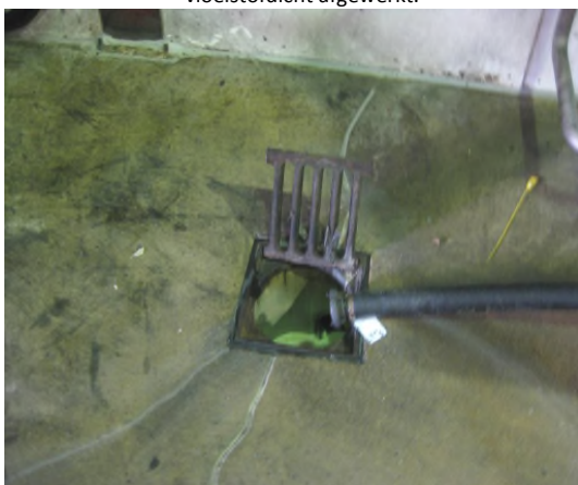
Fotonummer: 3 Omschrijving: Scheurvorming en onthechting voeg rondom kolk zijn vloeistofdicht hersteld.