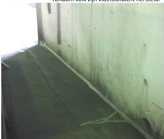
Fotonummer: 5 Omschrijving: Driehoeksvoeg langs wand is vervangen.