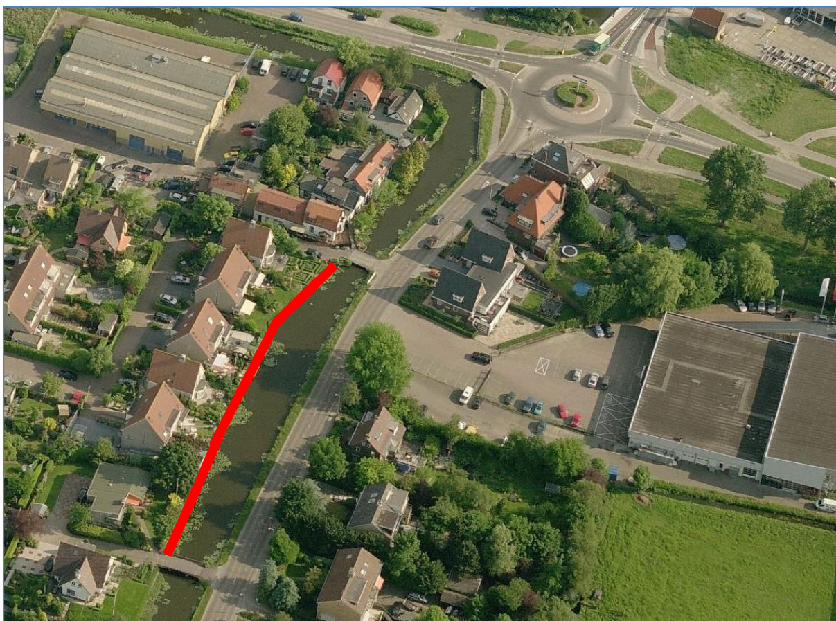
Traject waarvoor dit projectplan geldt, is in rood weergegeven