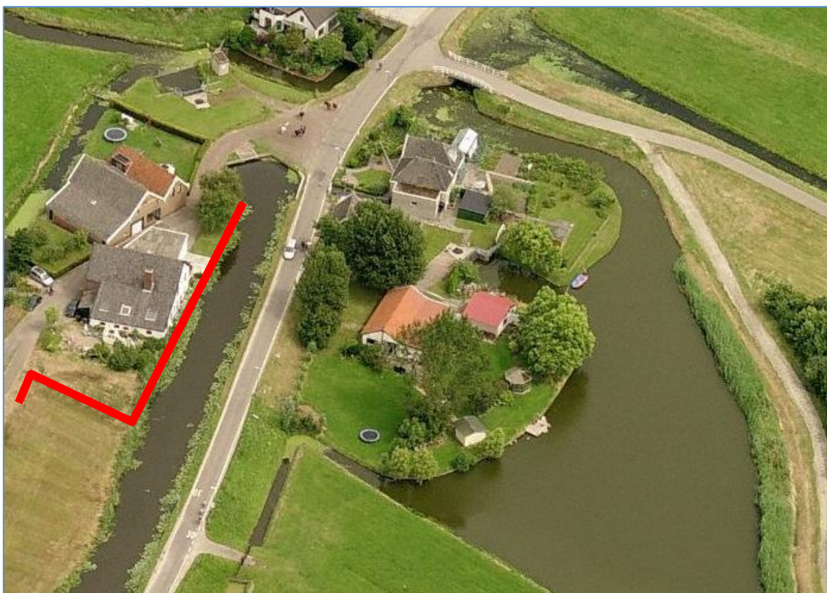
Tracé van het project is in rood weergegeven