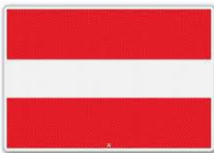
In-, uit- of doorvaart verboden (BPR, bijlage 7, A.1)