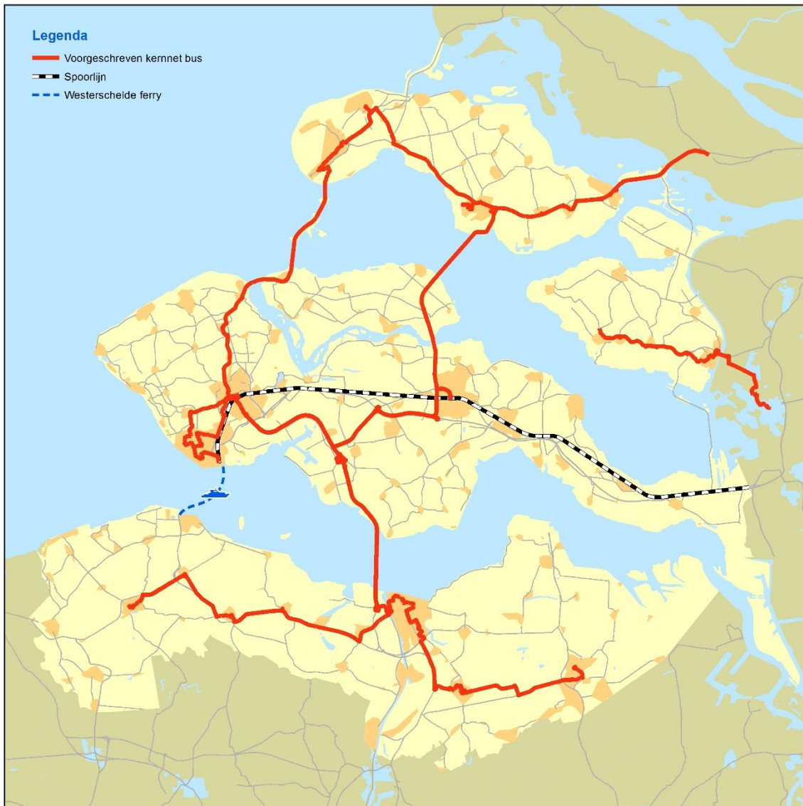
Westerschelde Ferry, treinverbinding en het voorgeschreven kernnet