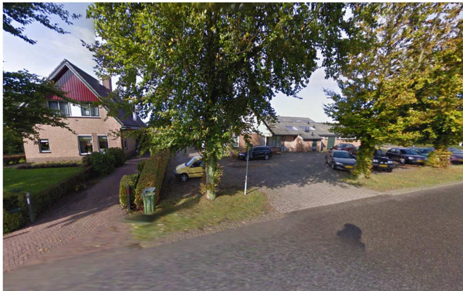
belendende bebouwing overzijde perceel