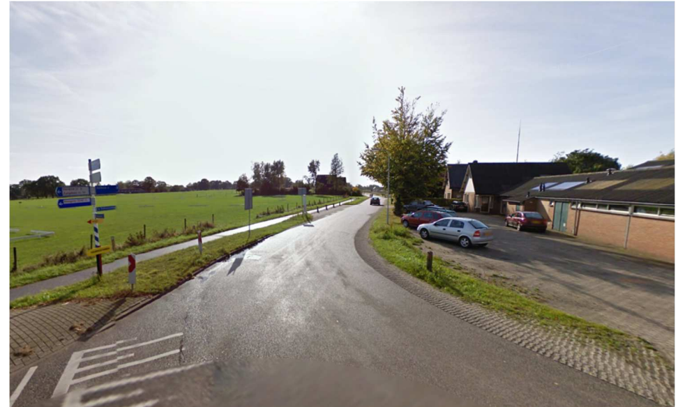
kruising Molenenk - Zelhemseweg