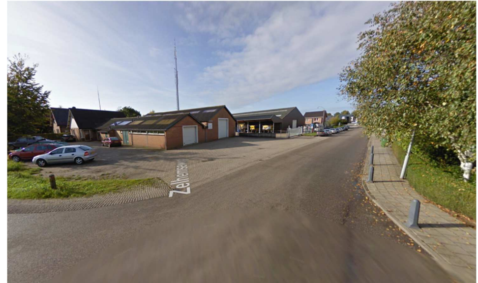
belendende bebouwing Molenenk