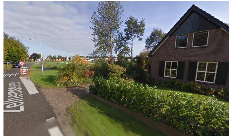
belendende bebouwing Zelhemseweg