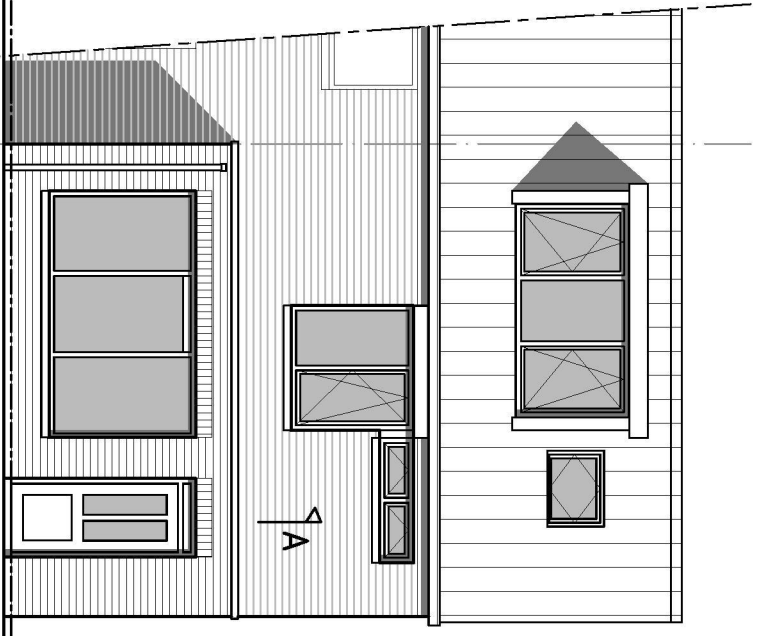
VOORGEVEL (NIEUW) A