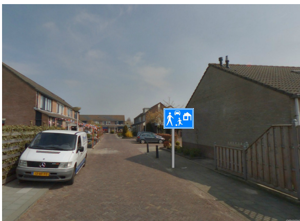
Figuur 2: Zuidelijke toegang woonerf vanaf Pastinaak verkeersbord G5, G6 op de achterzijde.