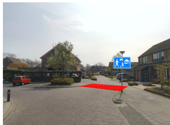
Figuur 3: Noordelijke toegang woonerf vanaf Krabbescheer verkeersbord G5, G6 op de achterzijde. In rood de te reconstrueren in- en uitgang van het woonerf.