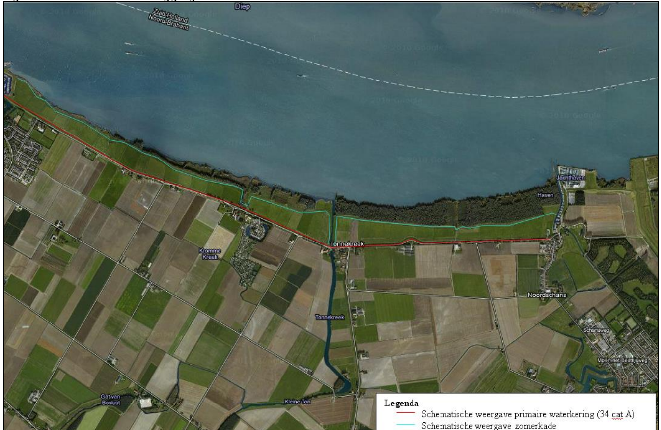
Figuur 1. Overzichtskaart ligging zomerkade

Deze legger heeft betrekking op de aanwezige zomerkade. Deze zomerkade is op dit moment nog niet aangewezen als zijnde een waterkering, de procedure om de zomerkade tot waterkering aan te wijzen is wel reeds opgestart.