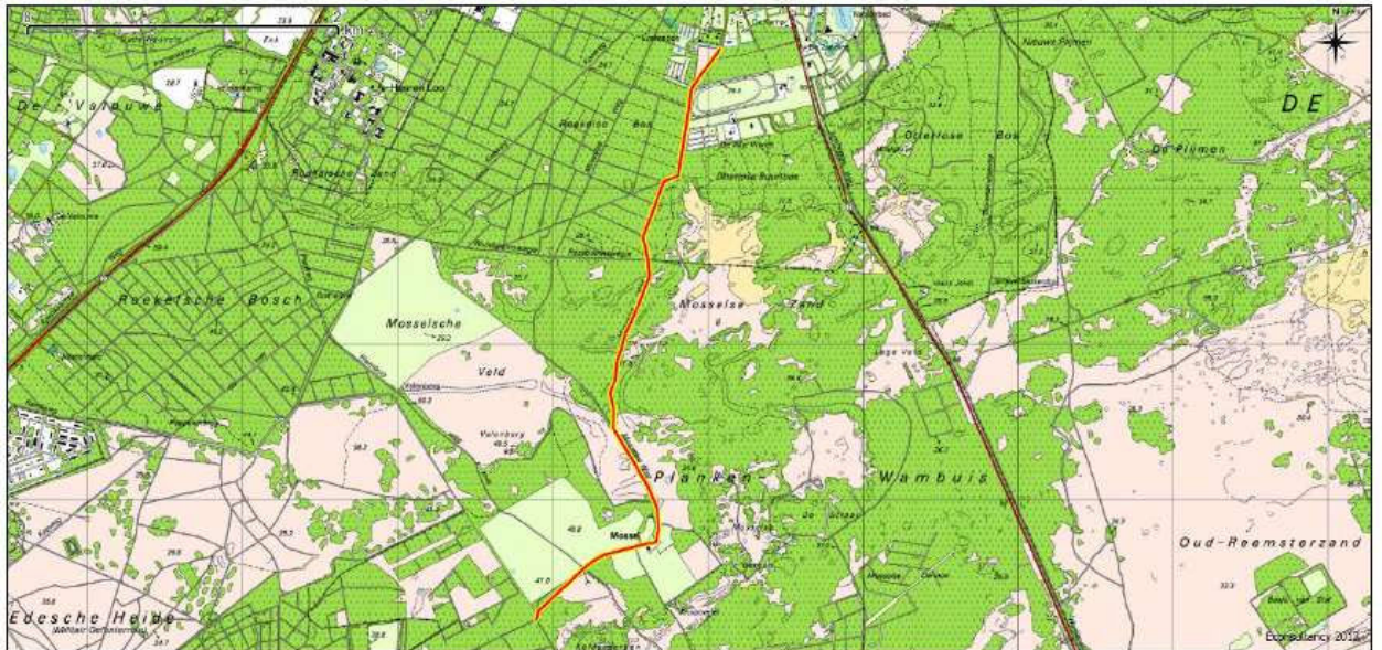
Figuur 1. Topografische ligging van de onderzoekslocatie (geel-rood).