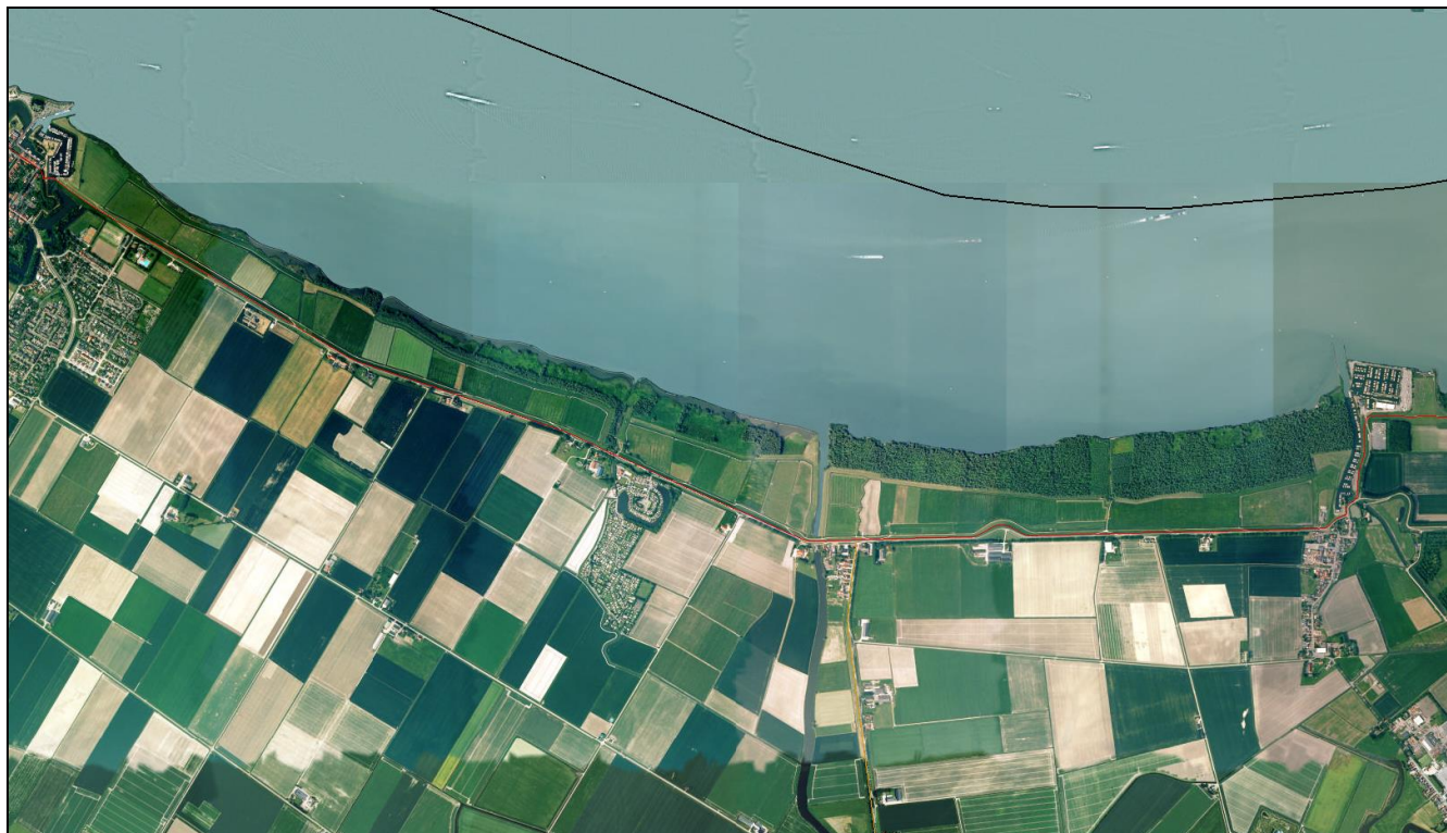
Figuur 2. Luchtfoto omgeving zomerkade (datum: mei/juni 2006)

De eerste functie is voor de aanwijzing als waterstaatswerk niet van doorslaggevend belang. Het achterliggende gebied heeft geen economische functie die tegen hoogwater beschermd moet worden. De natuurlijke dynamiek van een uiterwaard past prima bij het huidige gebruik als natuurgebied.