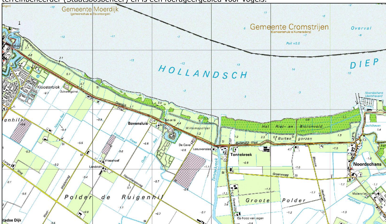
Figuur 1. Topografische ligging zomerkade

Langs het Hollands Diep ligt een primaire waterkering die West-Brabant beschermt tegen hoogwater op het Hollands Diep. Tussen Willemstad en Klundert ligt tussen de primaire kering en het Hollands Diep een uiterwaard (gorzen). Deze varieert in breedte, maar is gemiddeld 300 tot 400 meter breed. Hemelsbreed is het gebied ongeveer 5,8 kilometer lang. In de uiterwaard ligt in de huidige situatie een grondlichaam dat feitelijk functioneert als een zomerkade. Hieronder is een overzichtskaartje opgenomen van het gebied. De uiterwaarden kennen op dit moment een extensief gebruik. Het gebied is in eigendom en beheer bij een terreinbeheerder (Staatsbosbeheer) en is een foerageergebied voor vogels.