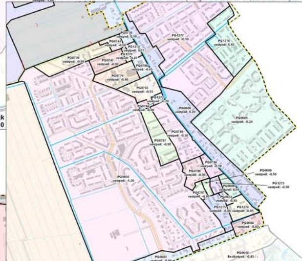
Detail Heeswijk Schaal: 1:5.000