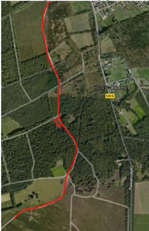
Afbeelding 1.1 Begrenzing van de plangebied (rood omlijnd)