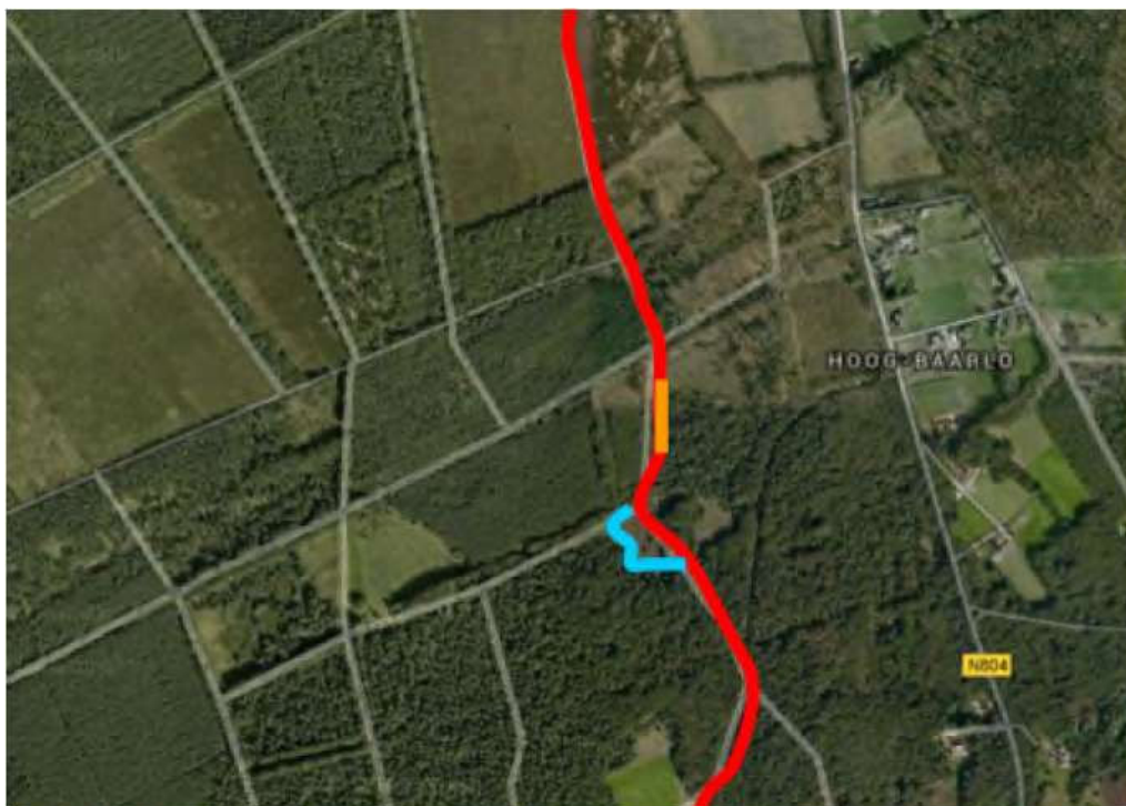
Afbeelding 3.4 Deel van het aan te leggen fietspad, in oranje het bruggetje over de slenk weergegeven. In blauw het