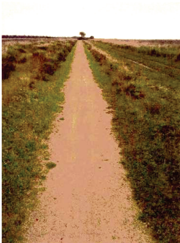
Foto fietspad gezien van west naar oost