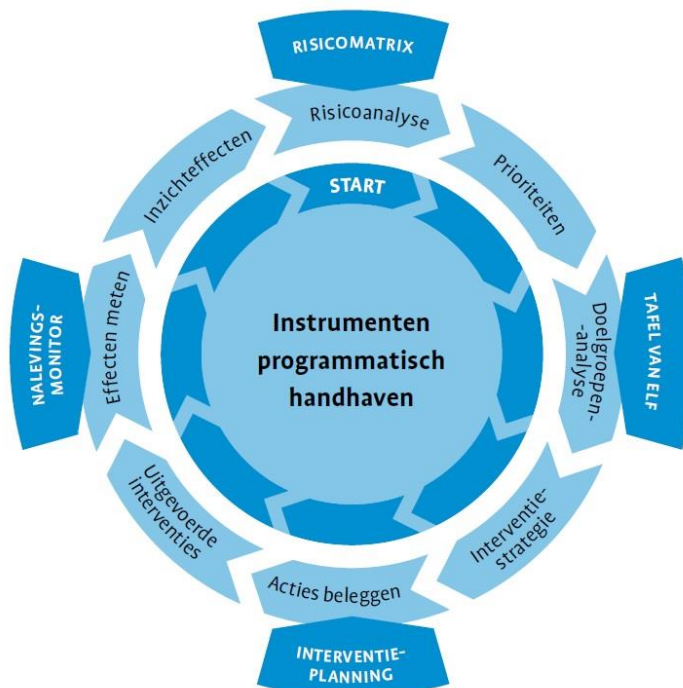
Schema 1 Programmatisch handhaven

Bij programmatisch handhaven worden te samen met in- en externe belanghebbenden de risico's ingeschat van het niet naleven van regels. Op basis hiervan ontstaat een goed overzicht van de handhavingstaken die prioriteit moeten krijgen. Vervolgens wordt aan de hand van de uitkomsten van een doelgroepenanalyse de meest geëigende interventiestrategie bepaald. Door de effecten van maatregelen uit de interventiestrategie te meten en te evalueren kan bepaald worden in hoeverre de gemaakte keuzes effectief zijn.