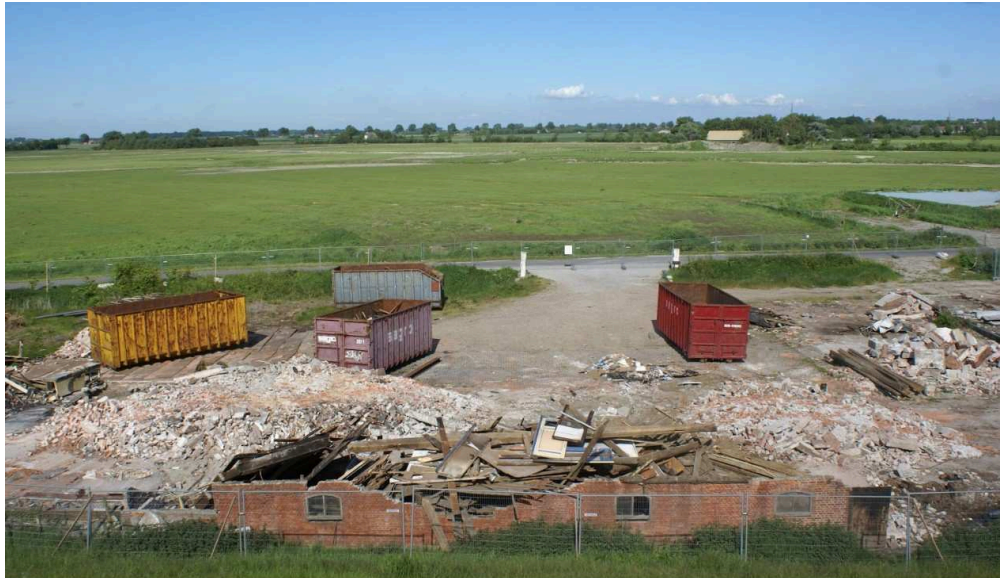
Figuur 2: resten van boerderij De Ruijter gedurende de sloop (foto Hans de Ruijter, mei 2009)