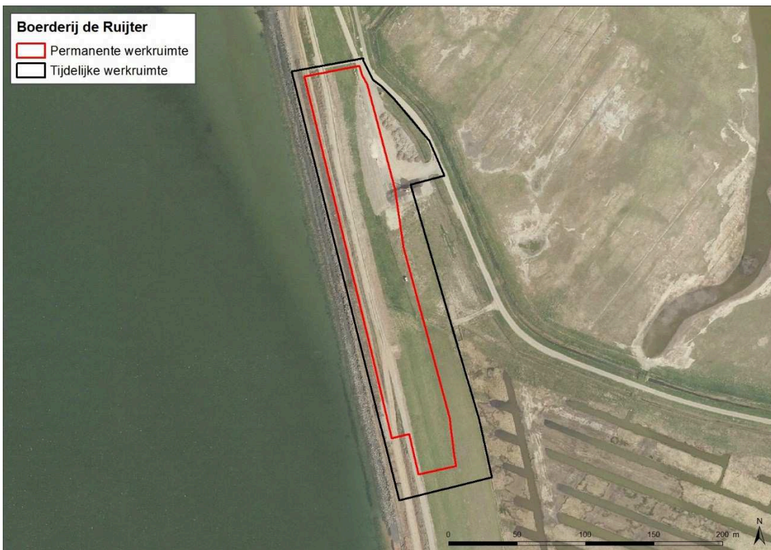
Figuur 1: Ligging van het projectgebied. Permanente werkruimte is het ruimtebeslag als gevolg van de herinrichting. De tijdelijke werkruimte is het aanvullend ruimtebeslag voor de duur van de werkzaamheden.

Enkele kilometers ten noordwesten van Zierikzee ligt langs de Oosterschelde bij Borrendamme het projectgebied. Over een lengte van 300 meter moeten werkzaamheden uitgevoerd worden om de stabiliteitsproblemen op te lossen. Figuur 1 laat de ligging van het projectgebied zien.