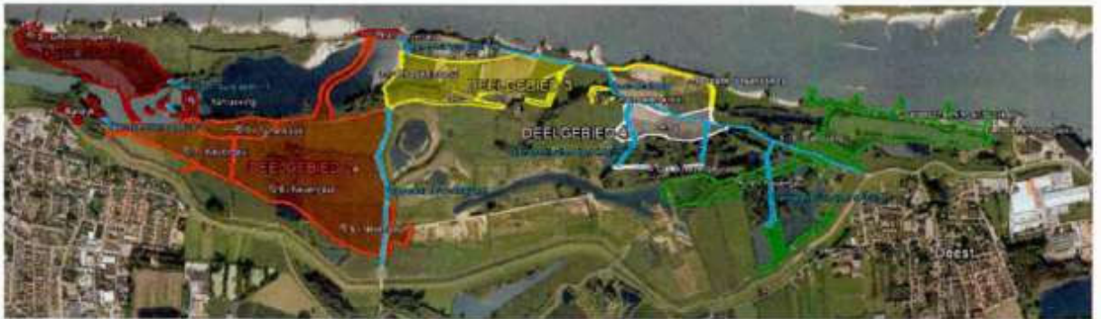
Figuur 3. Deelgebiedenindeling (1 t/m 5) bij de inrichtingswerkzaamheden in de ADW; rood: deel 1, oranje: deel 2, geel: deel 3, groen: deel 5; deelgebied 4 ligt tussen 2 en 5; hier zijn de inrichtingswerkzaamheden grotendeels afgerond.