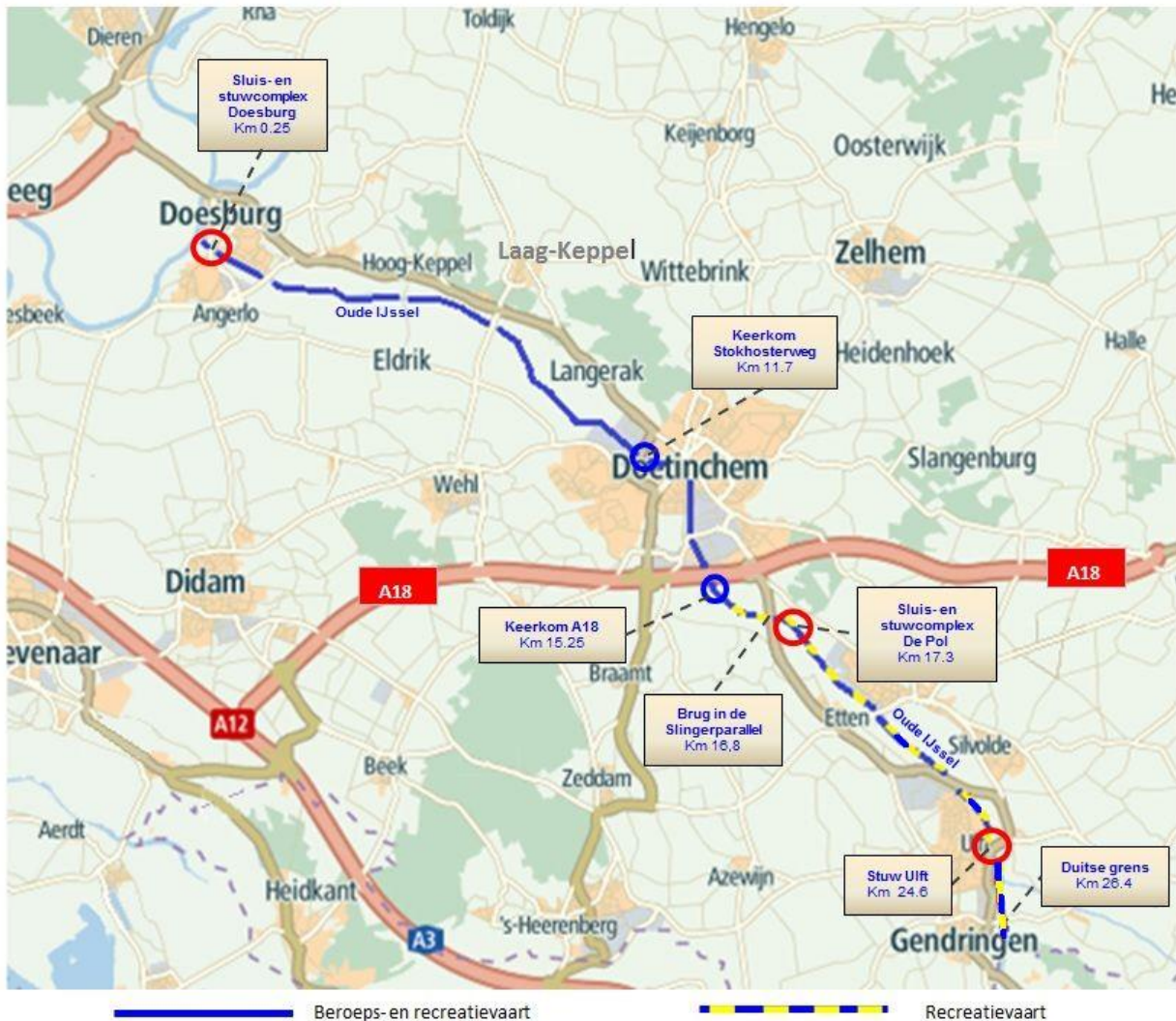
Figuur 1: beroeps- en recreatievaart op de Oude IJssel