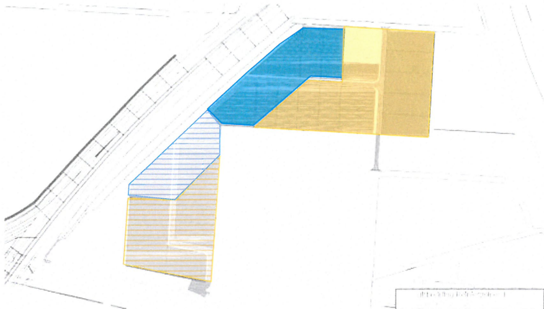
Overzichtstekening met welstandsniveaus (niveau 2=blauw, niveau 3=oranje)

Kritisch wordt gekeken naar hoofdaspecten. Licht naar deelaspecten en niet naar detailaspecten. Nieuwbouw van hoofdgebouwen / bouwwerken zoals woningen, bedrijfsgebouwen, gebouwen voor bijzondere doeleinden, geluidsschermen en kunstwerken in rij- en vaarwegen vallen onder de eisen als omschreven in niveau 2.