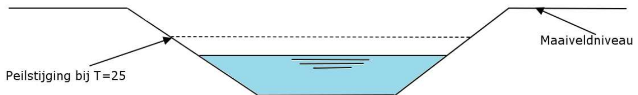
Afbeelding 1: Verbeelding peilstijging in oppervlaktewater

Een alternatieve vorm van waterberging is een alternatief voor het graven van extra oppervlaktewater. Bij compensatie door middel van het aanleggen van extra oppervlaktewater wordt bij het bepalen van het benodigde oppervlak uitgegaan van een neerslaggebeurtenis (van het KNMI) die eens in de 25 jaar kan optreden (T=25). Bij aanhoudende regenval is echter nog steeds ruimte in de watergangen om verder in peil te stijgen dan de peilstijging die optreedt bij T=25. Zie ter verduidelijking afbeelding 1. In een alternatieve vorm van waterberging moet eenzelfde hoeveelheid water worden geborgen. Om die reden wordt voor een alternatieve vorm van waterberging niet uitgegaan van een neerslaggebeurtenis van T=25, maar van T=100. Op deze manier komt de hoeveelheid waterberging, die in een alternatieve vorm van waterberging wordt gerealiseerd, redelijk overeen met de hoeveelheid waterberging die in het oppervlaktewater kan worden geborgen.