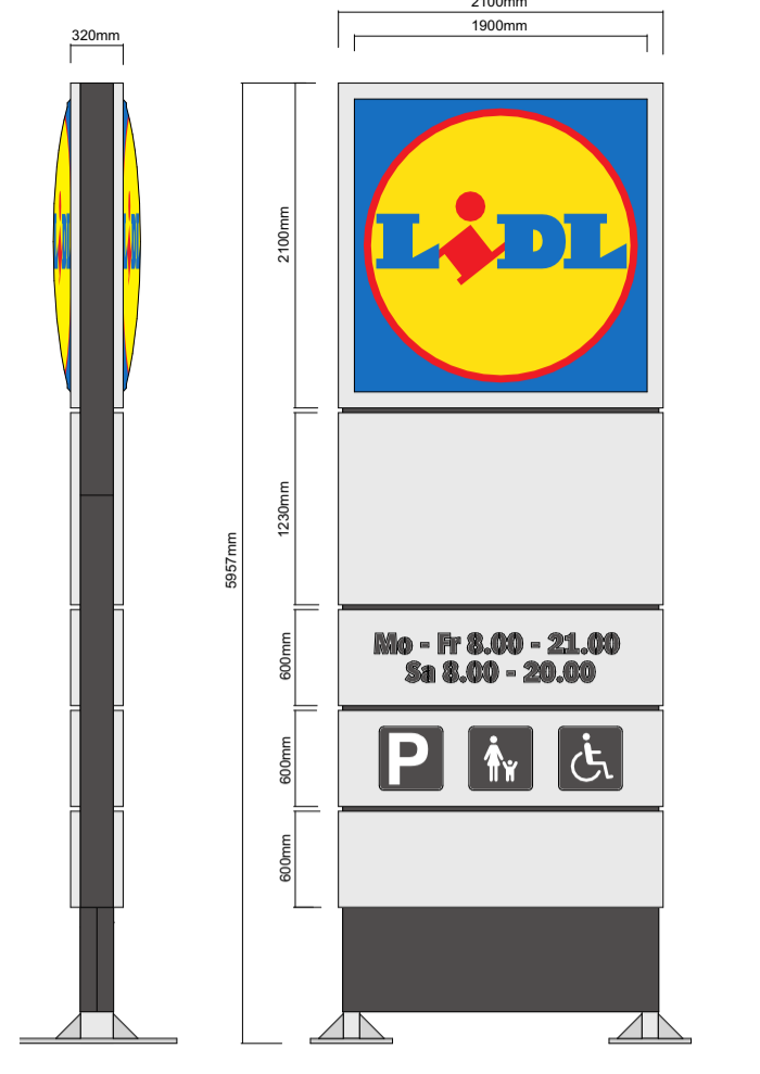
logobord schaal 1:50