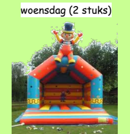
woensdag (2 stuks)