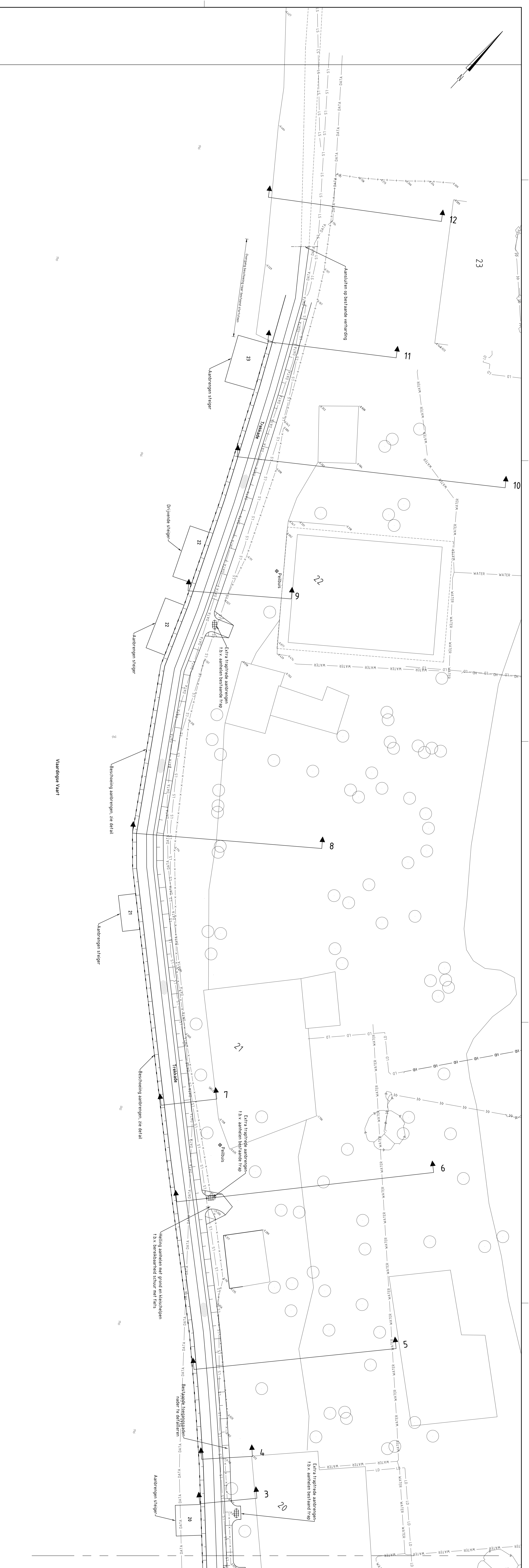
OVERZICHT 1 VAN 2