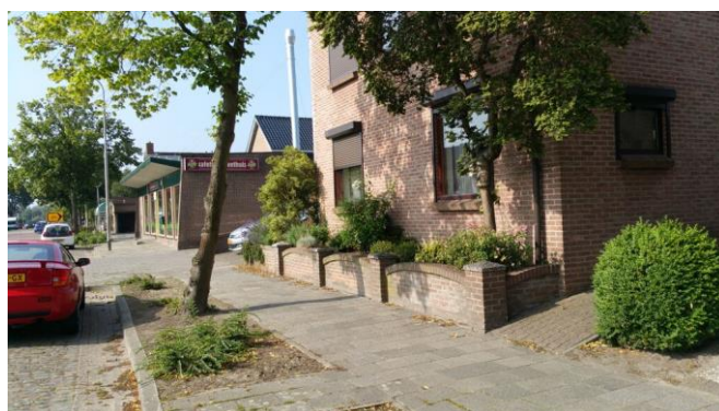
Bestaande HWA woonhuis voorzijde, straat aansluiting op gemeente bevindt zich op ca. 1 meter van voortuin.