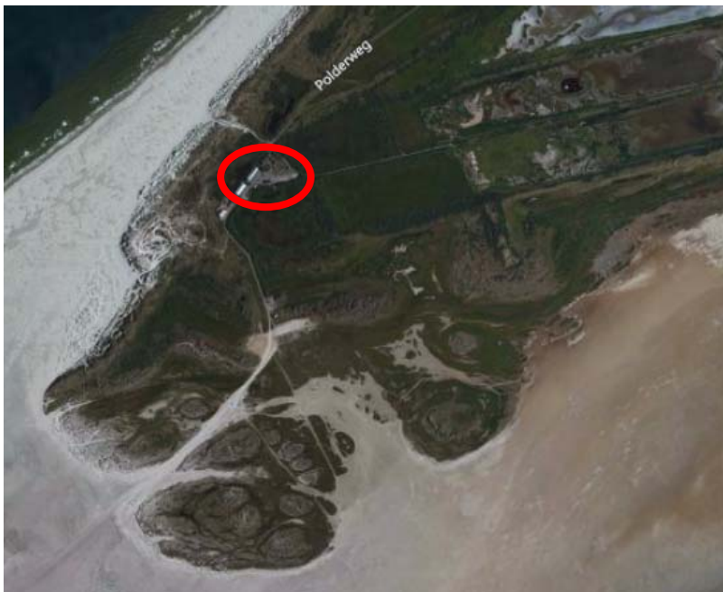
Figuur 1. De globale ligging van het plangebied

In het geldende bestemmingsplan is een wijzigingsbevoegdheid opgenomen om de bestemmingen van de als 'Wro zone-wijzigingsgebied 3' aangeduide gronden in dit bestemmingsplan te wijzigen ten behoeve van de plaatsing van zonnecollectoren. Het college van B&W van de gemeente Vlieland heeft aangegeven via wijziging van het bestemmingsplan medewerking te willen verlenen aan het wijzigen van de bestemming ten behoeve van de ontwikkeling van een zonneakker. Dit wijzigingsplan geeft een invulling aan deze wijzigingsbevoegdheid.