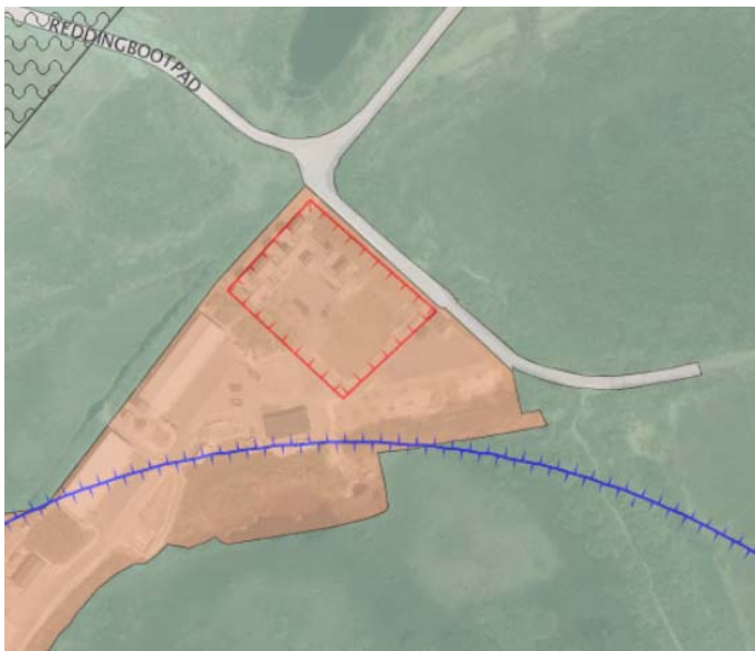
Figuur 2. Plangebied gelegen in Wro-zone - wijzigingsgebied 3

Deze toelichting gaat op de verschillende onderdelen in.