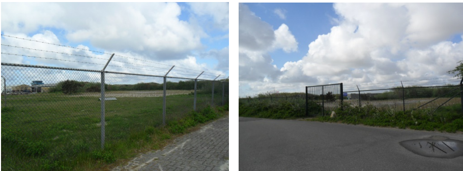
Figuur 3. Aanzicht huidige situatie

Het plangebied van dit wijzigingsplan heeft betrekking op de militaire gronden ten westen van Vlieland aan het einde van de Polderweg. De zonneakker komt te liggen op een perceel ten noorden van het militaire terrein. Het betreft het voormalige Cavalerie Schiet Kamp (CSK) terrein. Op de locatie waren een aantal gebouwen aanwezig, waarin het leger was gehuisvest. Het gebied is afgesloten met een hekwerk. Een aanzicht op het perceel is weergegeven in figuur 4. Hierop is de voormalige bebouwing nog te zien. Deze is inmiddels gesloopt.