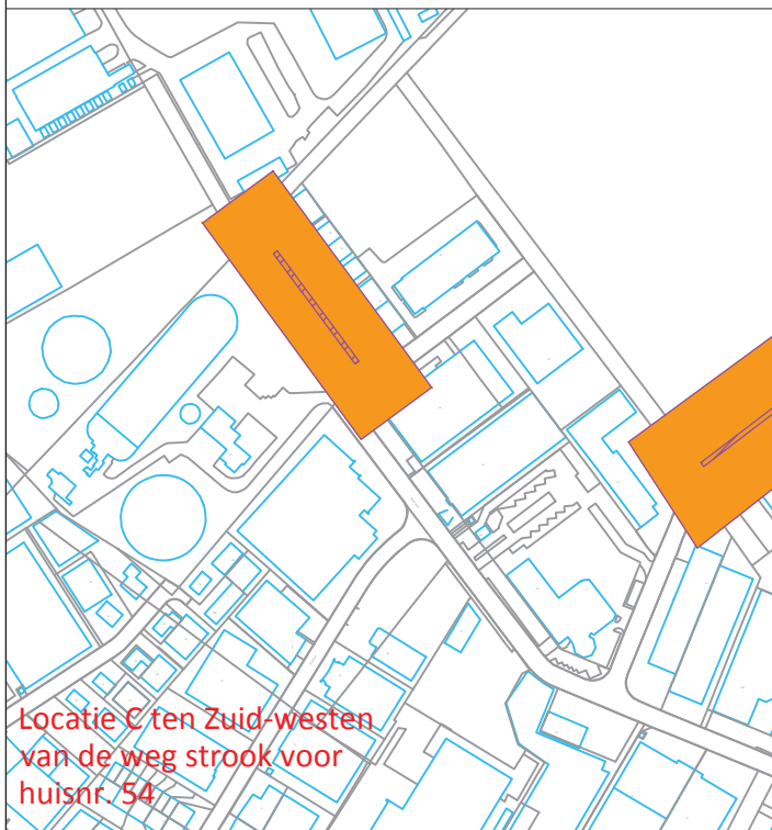
Locatie C ten Zuid-westen van de weg strook voor huisnr. 54