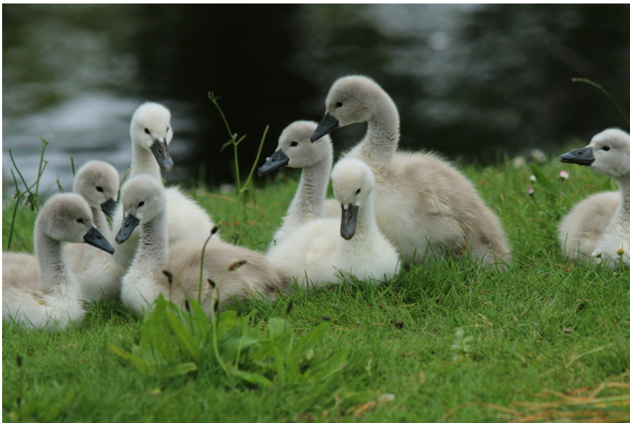
Ouderparen met niet vliegvlugge jongen worden met rust gelaten.

*In vogelrichtlijngebieden (samen met Habitatrichtlijngebieden ook Natura-2000 gebieden genoemd) is in de winterperiode vergunning van de Natuurbeschermingswet nodig voor het gebruik van het geweer. Een aantal WBE's beschikt sinds de winter van 2014/2015 over een dergelijke vergunning.