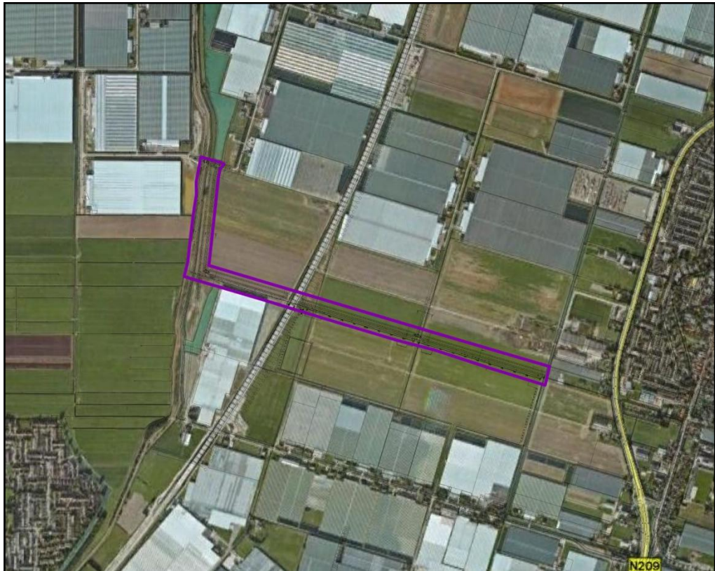
Figuur 1: Begrenzing onderzoeksgebied.

Het onderzoeksgebied is gelegen in de gemeente Lansingerland (zie figuur 1) en wordt begrensd door de provinciale weg 209, de Hyacintenweg, de Krokussenweg en de Benjamin Vermeerweg. Een gedeelte van het tracé van de HSL doorkruist het onderzoeksgebied.