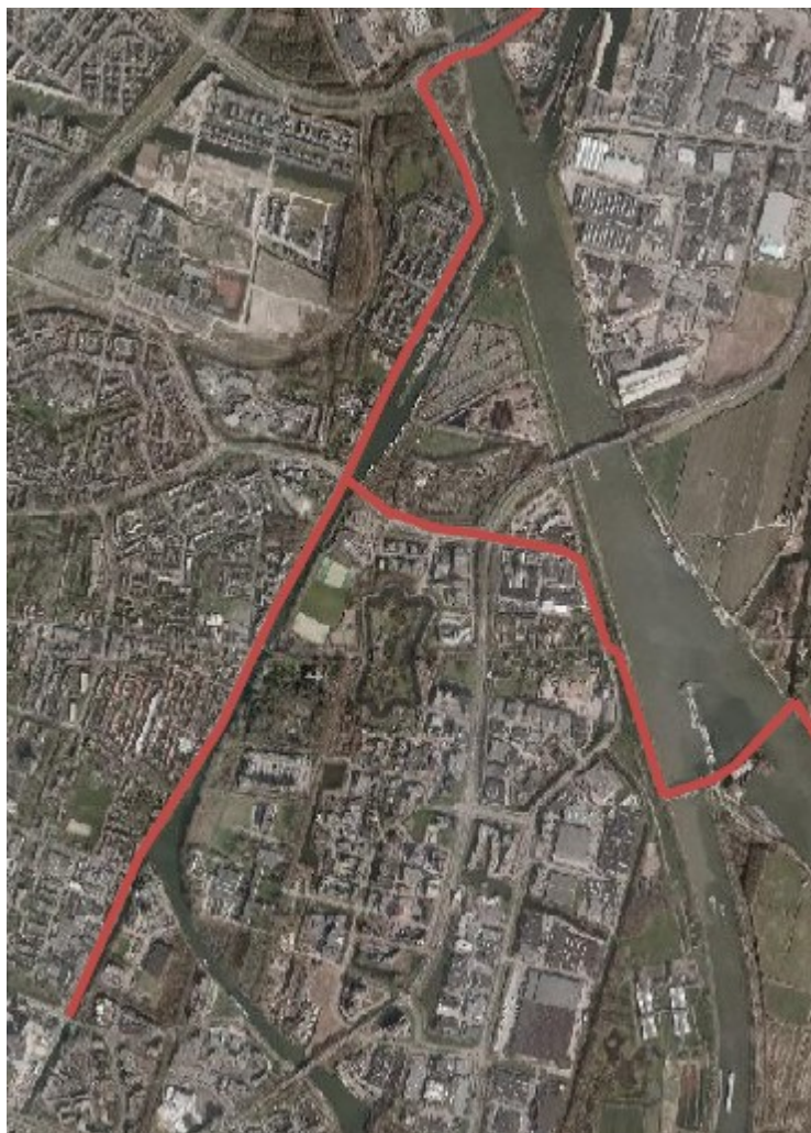
Overzichtskaat van Fiets Filevrij route Nieuwegein.

De noord-zuidroute staat voor 2013 op de uitvoeringsagenda. De oost-west route (van en naar Plofsluis) is een wenselijke route die in samenhang met de brug over het Amsterdam Rijnkanaal moet worden ontwikkeld. In 2014 moet onderzocht worden wat de meest wenselijke inrichting voor fietsers is. Verkeersveiligheid is hier maatgevend.