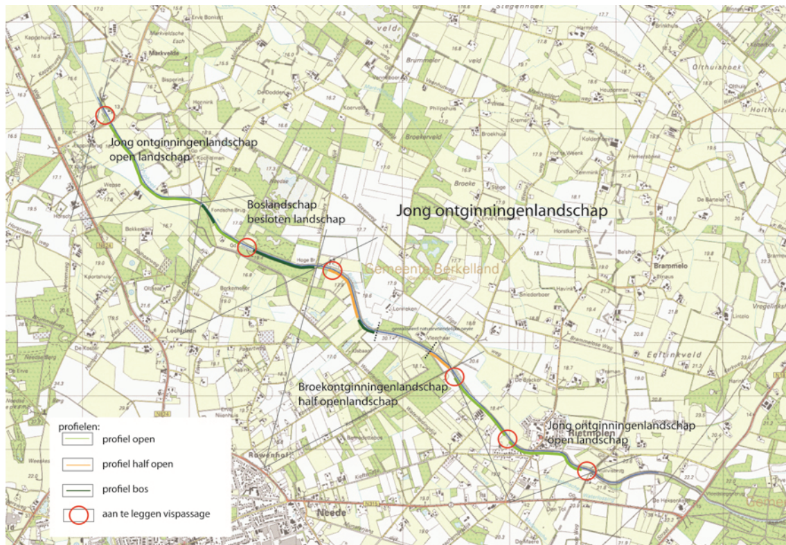
Figuur 1: Overzicht landschapstypen en oeverinrichtingen

Voor het traject stellen wij een drietal profielen voor die gebaseerd zijn op de landschappelijke kwaliteiten van directe omgeving van de Buurserbeek. Elk profiel wordt afgestemd op het type landschap welke de beek doorsnijdt. Een ‘open profiel’ door het jong ontginningslandschap, ‘half open profiel’ door het broekontginningslandschap en een ‘bos profiel’ door het boslandschap. Op deze manier voegt het profiel zich in het landschap. De profielen bestaan uit natuurvriendelijke oevers met variabele bodemdpte.