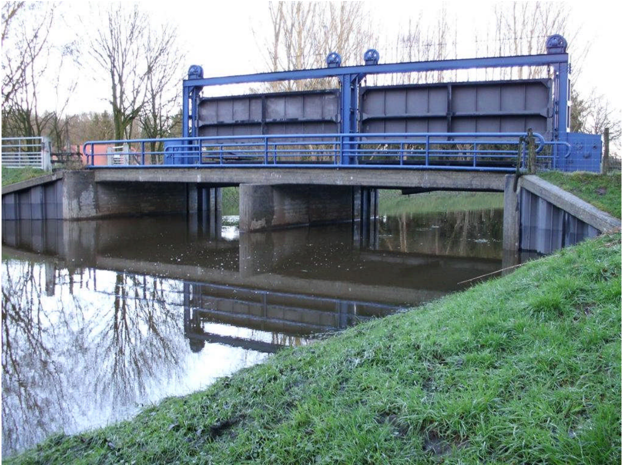
Figuur 2 Verdeelwerk in het Groene Kanaal