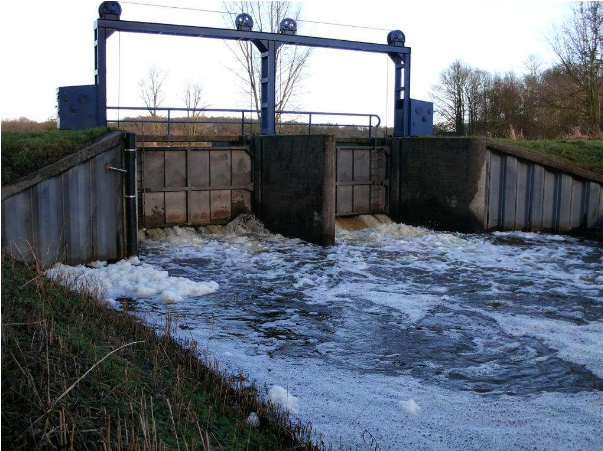
Figuur 3 Verdeelwerk in de Baakse Beek