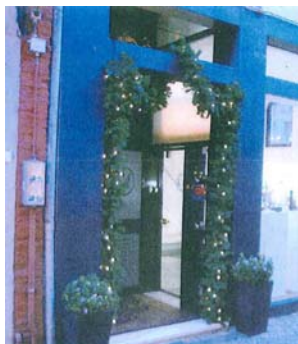
✓ Evenwichtige verhouding