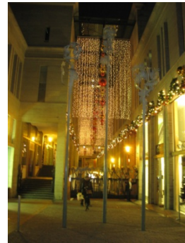
✓ Rustig kleurbeeld