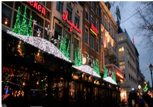
✗ Bonte kleuren overheersen