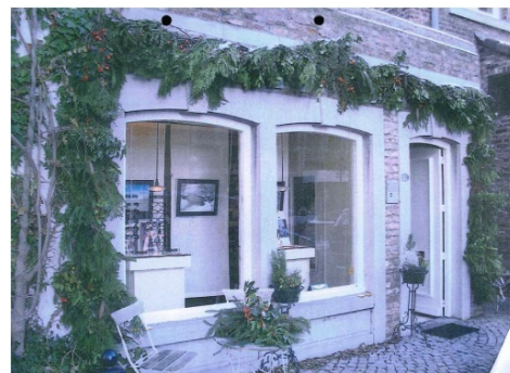
✓ Evenwichtige verhouding