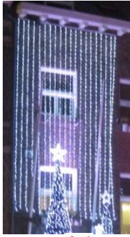
✗ Verhullende verlichting

Toelichting: De architectuur van het gebouw en de gevelstructuur moet herkenbaar blijven.