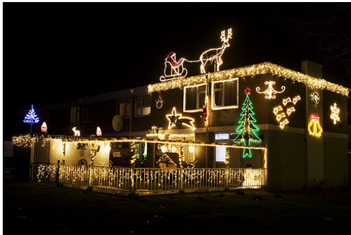
✗ Overdadige verlichting

Toelichting: Te veel en te uitbundig is niet goed. De verlichting werkt dan verstikkend en haalt de aandacht weg van de architectuur in plaats van deze te versterken.