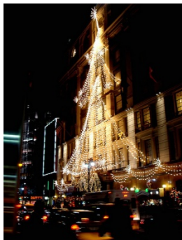
✗ Verlichting niet in verhouding tot de gevel

Toelichting: Indien de versiering qua maat wordt aangepast aan de maten en verhoudingen van de gevel ontstaat een samenhangend beeld.