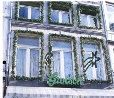
✓ Evenwichtige verhouding