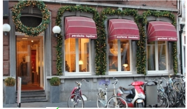
✓ Herkenbare architectuur

2. De kerstverlichting mag niet overdadig zijn;