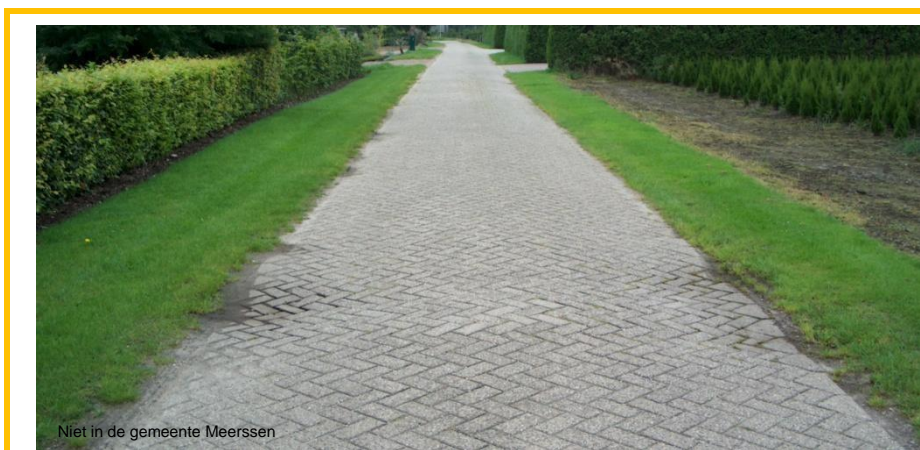
Niet in de gemeente Meerssen

Er dient binnen vijf jaar rekening gehouden te worden met onderhoud.