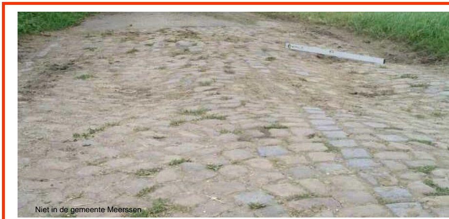
Niet in de gemeente Meerssen

Binnen twee jaar dient er onderhoud uitgevoerd te worden.