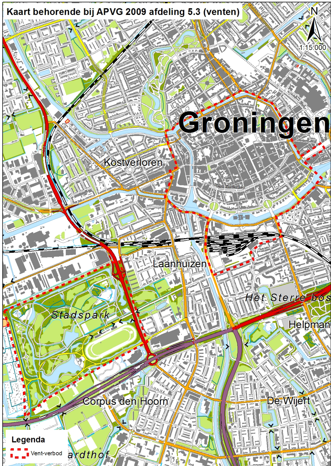
Kaart behorende bij Bijlage 33 bij de APVG 2009 (venten)