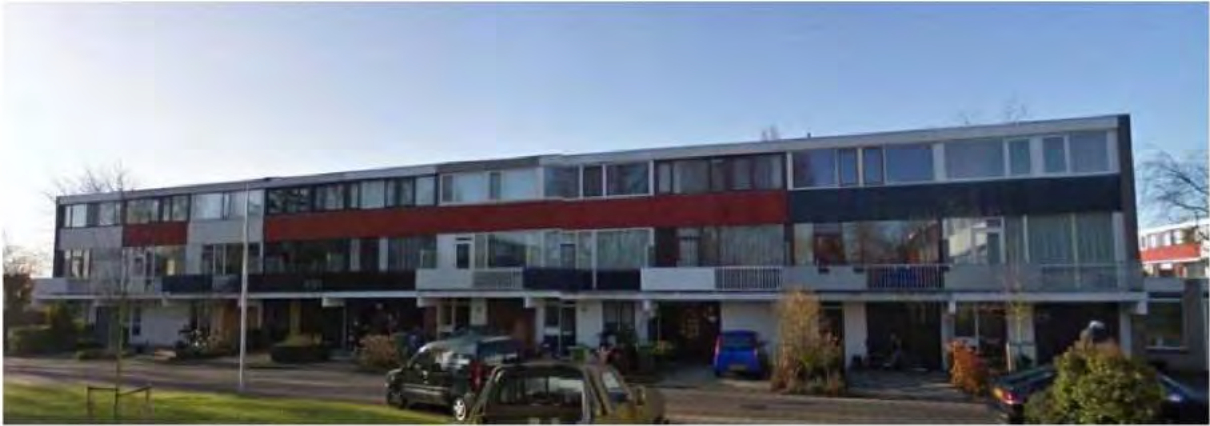
Straatbeeld Mozartplein 17 t/m 35, maart 2010