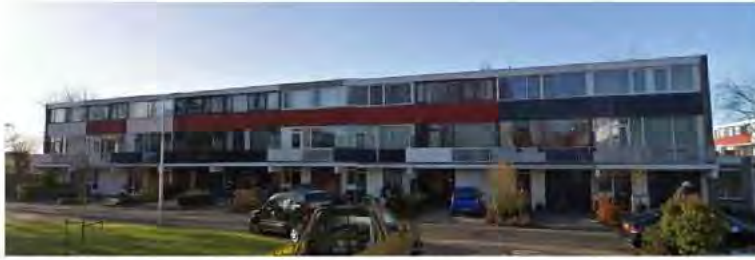
Straatbeeld Mozartplein 17 t/m 35, maart 2010