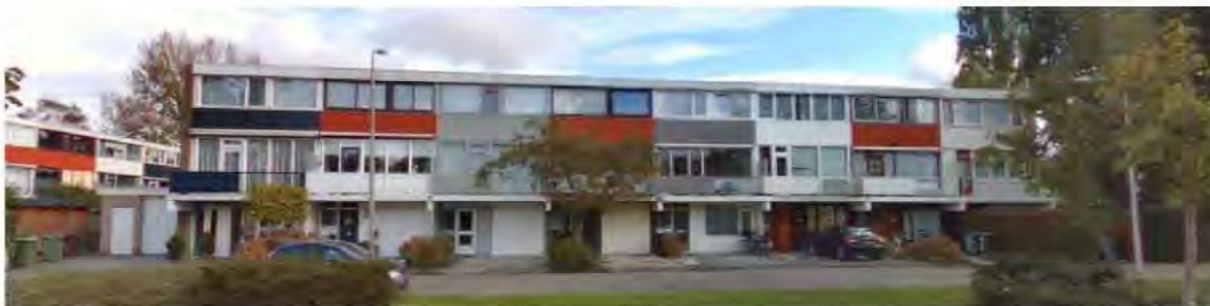
Straatbeeld Berliozplein 1 t/m 15, oktober 2014

Het oorspronkelijk materiaal- en kleurgebruik is nog redelijk in tact, waardoor de stroken nog redelijk duidelijk naar voren komen.