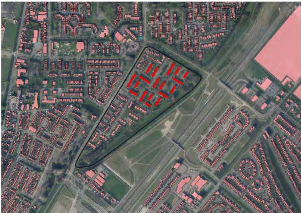
De drive-in woningen in de Componistenbuurt

Aan de overzijde van de Oostersingel ligt de Bomenbuurt. Dit is een jaren '80 wijk met hoofdzakelijk grondgebonden rijwoningen in de vorm van twee lagen en een kap. Ten zuiden van de Bomenbuurt langs de Oostersingel ligt het langgerekte Huijgensplantsoen. Hier achter ligt de wijk Berkel-Dorp. Deze wijk bevat net als de Componistenbuurt drielaagse drive-in woningen. Een groot deel van deze woningen is voorzien van een dakopbouw in de vorm van een dwarskap over de gehele breedte en diepte van de woning. Deze woningen zijn vanaf de Oostersingel zichtbaar. In het zuiden van de kern Bleiswijk bevindt zich overigens ook een wijk met soortgelijke drive-in woningen. Deze woningen zijn niet voorzien van dakopbouwen.