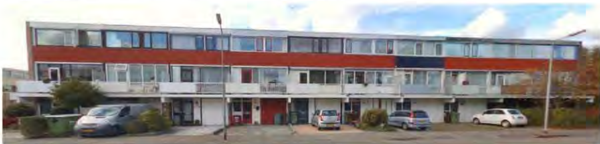
Straatbeeld Wagnerstraat 1 t/m 19, oktober 2014

Het volume van alle stroken is opgebouwd uit drie bouwlagen met een plat dak en een rechte rooilijn aan de voor- en achterzijde. De gevelopbouw van de woningen is ook gelijk. De dakrand, de doorlopende gevelplaat en de balkons (afwisselend open en gesloten), accentueren de lengte en de horizontale massa van de strook. De variatie zit in de uitstraling van de woningen. In de loop der jaren is deze geïndividualiseerd door gebruik van diverse materialen, kleuren, etc. De oorspronkelijke eenheid in de gevels is hierdoor verloren gegaan en het beeld raakt verrommeld. De eenheid van de stroken is nog wel goed herkenbaar door de heldere volumeopbouw en de gevelopbouw.