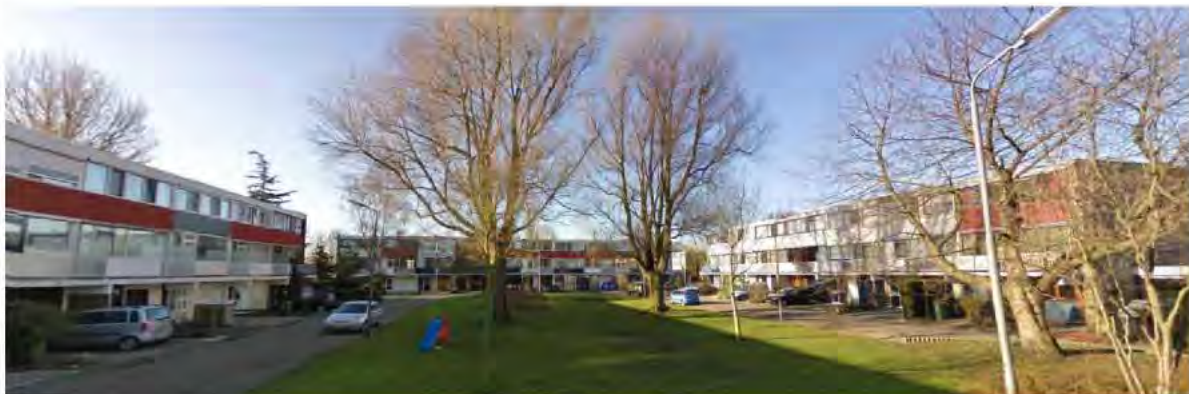
Straatbeeld Mozartplein, maart 2010