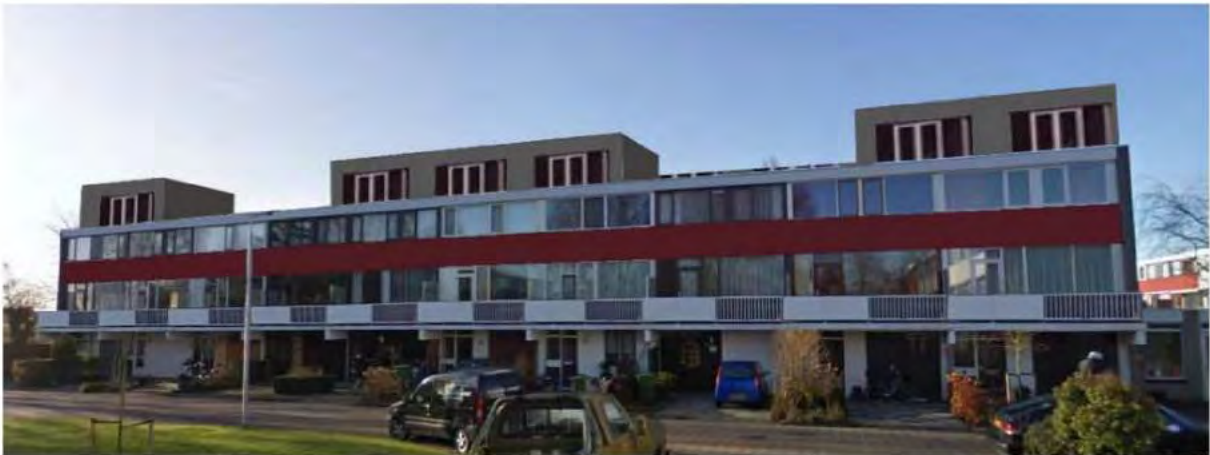
Eenheid in beeldkwaliteit van de dakopbouwen in combinatie met het terugbrengen van de continuïteit in de bestaande stroken.