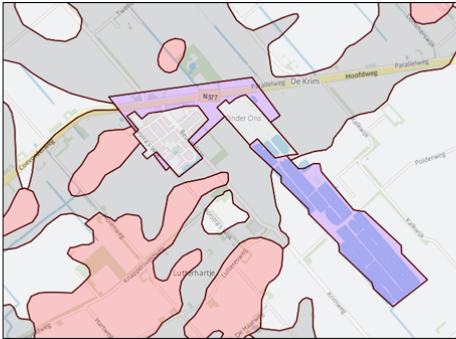
Uitsnede Archeologische waarden- en verwachtingenkaart