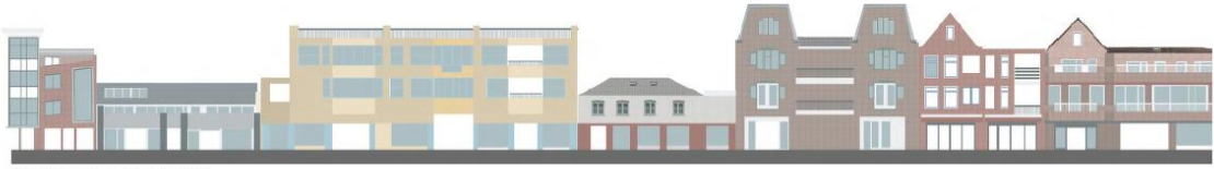
* Touwslagersbaan - noord - abstracte weergave