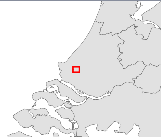
KAARTBIJLAGE 6 CULTUURHISTORISCHE INVENTARISATIE