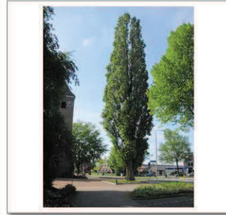
4 Dalvoordeweg kerk, Italiaanse populier