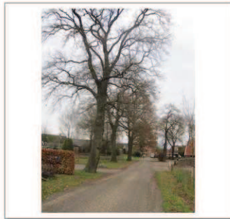
12 Hellendoornseweg 7a, Eik 4st