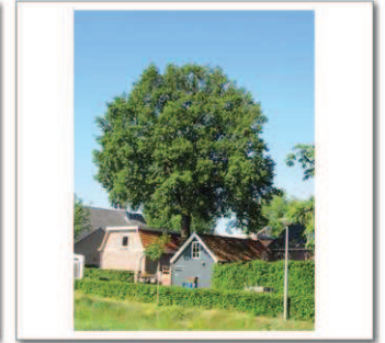
6 Dalvoordeweg 14 achtertuin, Eik