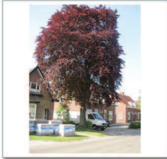
1 Groeneweg 10, Bruine beuk