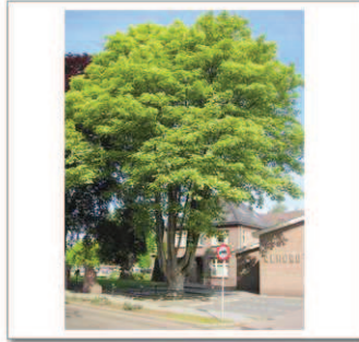
2 Groeneweg kerk, Esdoorn