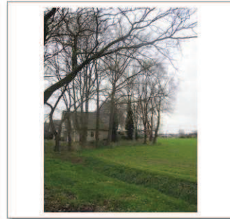
10a Esweg 1-5 achterlangs, Eikenlaan