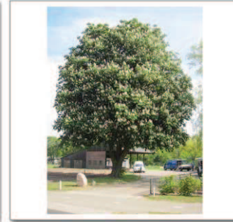
5 Hellendoornseweg 4, Paardenkastanje