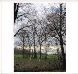
11b Hellendoornseweg 7a, Eikenlaan