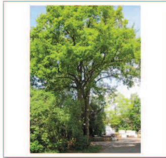
8 Dalvoordeweg 13, Eik 2st