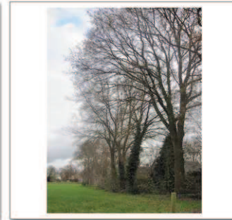
10b Esweg 1-5 achterlangs, Eikenlaan