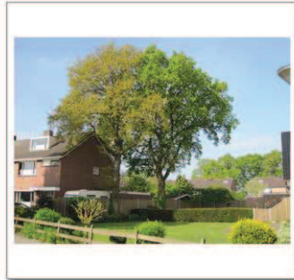
9 E J Boschweg 1-3, Eik 2st