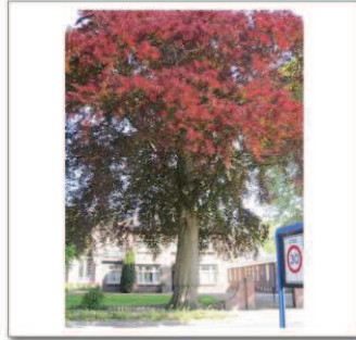
3 Groeneweg kerk, Bruine beuk