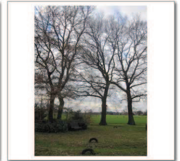
11a Hellendoornseweg 7a, Eikenlaan