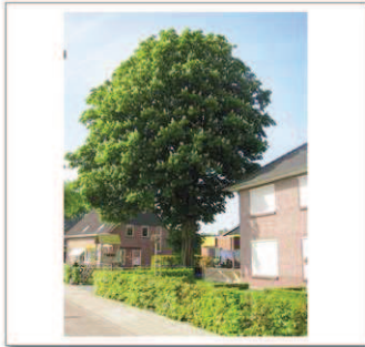
7 Dalvoordeweg 11, Paardenkastanje