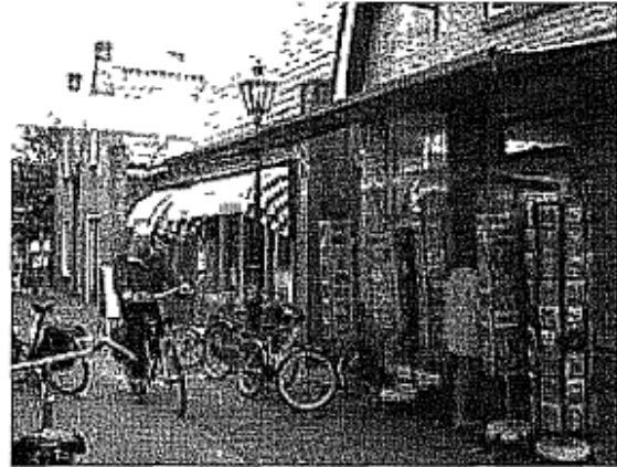
De gezelligste straat: de Visserssteeg