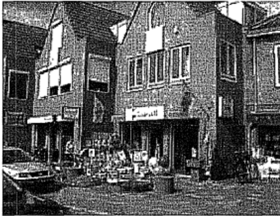
Speelgoedwinkel Inter Toys: overig recreatief aanbod