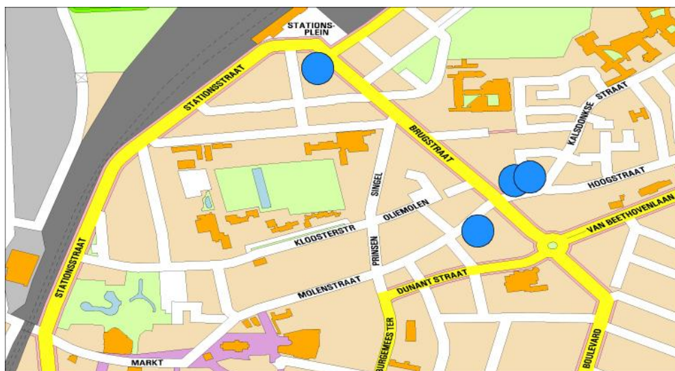
Figuur 1: situering Station, Molenstaat, Hoogstraat, Brugstraat en de vier gedoogde coffeeshops

De tweede locatie betreft de omgeving van het NS-station aan het Stationsplein in Roosendaal. Roosendaal is een belangrijk grensstation en daarmee goed bereikbaar vanuit Frankrijk en België. Drugrunners/dealers zijn actief in de directe omgeving van deze locatie. Zij spreken reizigers die arriveren in Roosendaal al aan op het perron of in de stationshal in Roosendaal en trachten de drugstoeristen naar één van de niet gedoogde verkooppunten te leiden in de omgeving van de Brugstraat en de Molenstraat of trachten op straat een deal met hen te sluiten. Uiteraard zijn er ook drugstoeristen die per trein in Roosendaal arriveren en inmiddels de weg naar de gedoogde coffeeshop nabij het station weten te vinden. Er heeft softdrugsverkeer plaats tussen de beide hotspots.