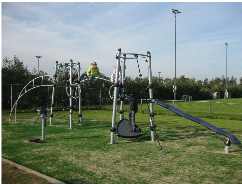
Uitdagens speeltoestel dat eind 2009 geplaatst is in Ammerstol.