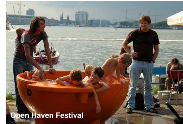
Open Haven Festival

huren) een bus die de scholen langsgaat, zodat kinderen de mogelijkheid krijgen naar de instellingen toe te gaan. Het stadsdeel zou, in samenwerking met de cultuurinstellingen, een (tijdelijk) project kunnen opstarten om gedeeld vervoer voor de educatie in het stadsdeel te realiseren.