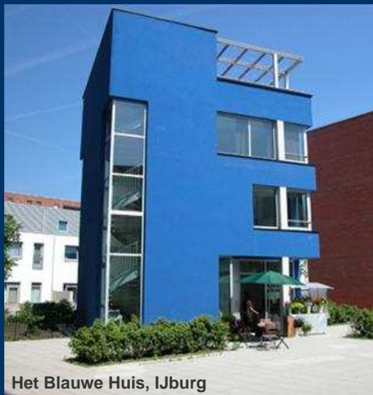
Het Blauwe Huis, IJburg

Zoals hiervoor beschreven heeft het stadsdeel voor de komende beleidsperiode de ambitie zijn cultuurbeleid te professionaliseren. Een herziening van de begroting is nodig om de ambities de komende beleidsperiode te kunnen realiseren.