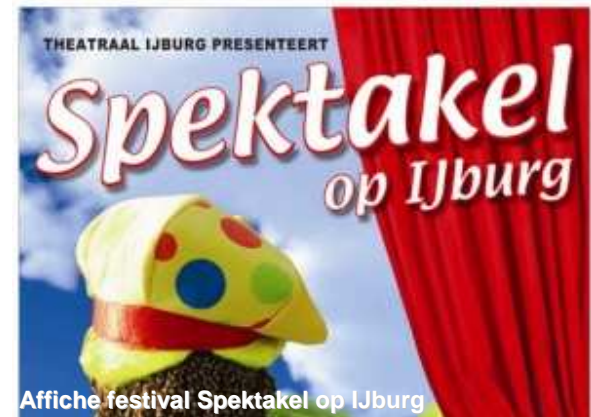
Affiche festival Spektakel op IJburg