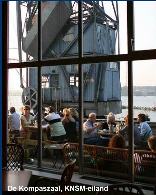
De Kompaszaal, KNSM-eiland

We onderscheiden vier rollen die een stadsdeel kan vervullen in het cultuurbeleid. Bij de toekenning van de rollen is bewust onderscheid gemaakt tussen een reactieve en een proactieve houding die we kunnen aannemen.