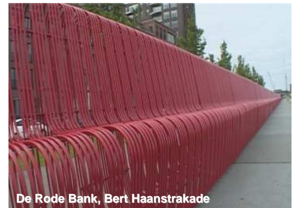
De Rode Bank, Bert Haanstrakade

Als het Dagelijks Bestuur positief staat tegenover het initiatief, volgt uitvoering. Afhankelijk van de situatie treedt het stadsdeel op als opdrachtgever of enkel als begeleider van het proces. De kunstenaar is verantwoordelijk voor de realisatie.