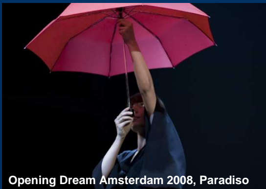
Opening Dream Amsterdam 2008, Paradiso

Zeeburg is een kleurrijk en levendig stadsdeel dat wordt gekenmerkt door vier diverse wijken, indrukwekkende architectuur en historie, veel water en een groeiend aantal inwoners, waaronder veel jeugd en jongeren. Zeeburg heeft een indrukwekkend aanbod van kunst en cultuur, onder meer in de vorm van festivals, architectuur, professionele (podiumkunst)faciliteiten, kunst in de openbare ruimte en een rijk verleden. Zeeburg is een stadsdeel dat de komende jaren sterk in ontwikkeling is. Dit beleidsdocument gaat - met het oog op het bestaande én op de toekomst - in op hoe kunst en cultuur in Zeeburg nog beter tot hun recht kunnen komen.