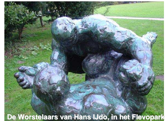
De Worstelaars van Hans Jdo, in het Flevopark