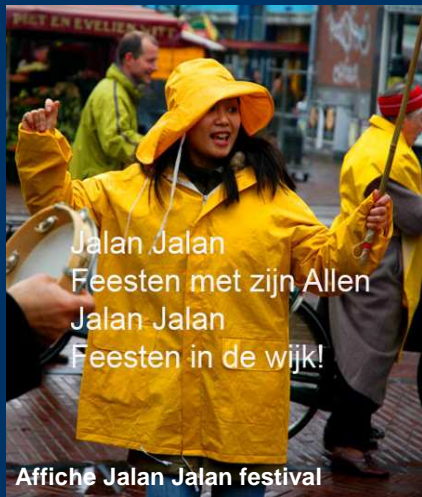
Affiche Jalan Jalan festival

Diverse partijen staan omschreven als partner waarmee (in de toekomst) meer kan worden samengewerkt. Partners zijn onontbeerlijk voor de totstandkoming en uitvoering van een gedragen en op andere beleidsterreinen afgestemd beleid.