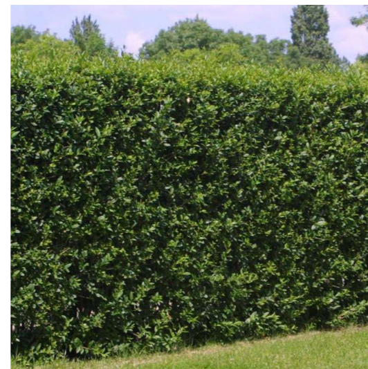
Dichte wintergroene, driftreducerende haag als afscheiding op westelijke erfgrans