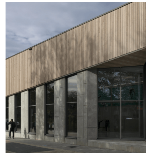
Voorbeeld krachtige vormgeving en passende kleuren en materialen