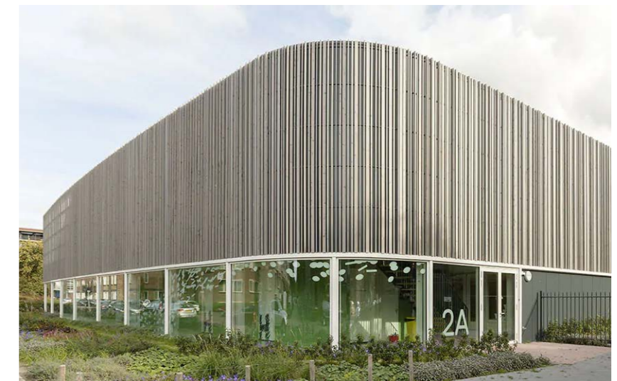
Voorbeeld alzijdige oriëntatie, sterke relatie met de omgeving en passende kleuren en materialen