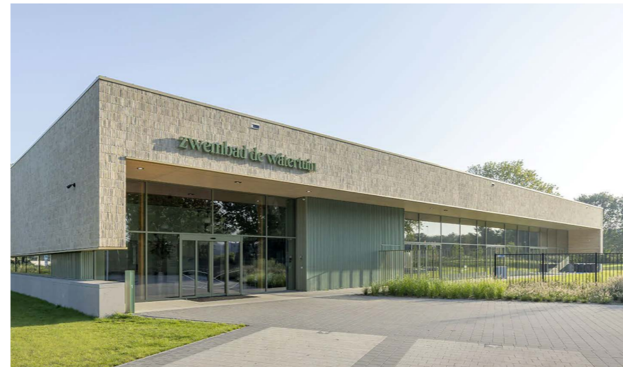
Voorbeeld duidelijk herkenbare entree, krachtige vormgeving, passend kleurgebruik en sterke relatie met de omgeving