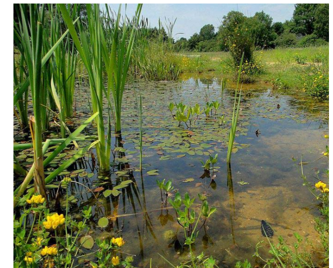
Waterpartij met natuurvriendelijke oevers