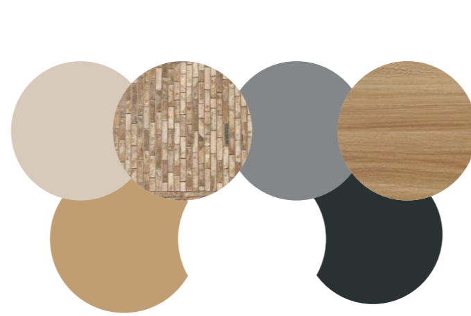
Indicatie kleur- en materiaalgebruik