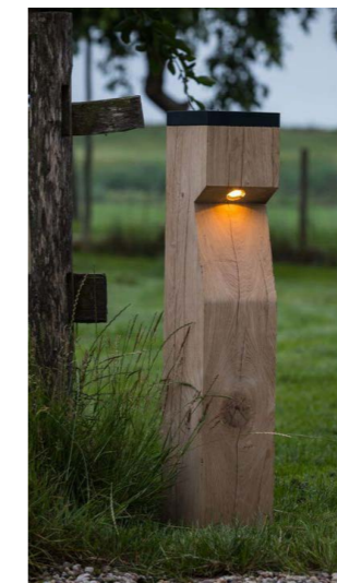
Lage houten verlichting