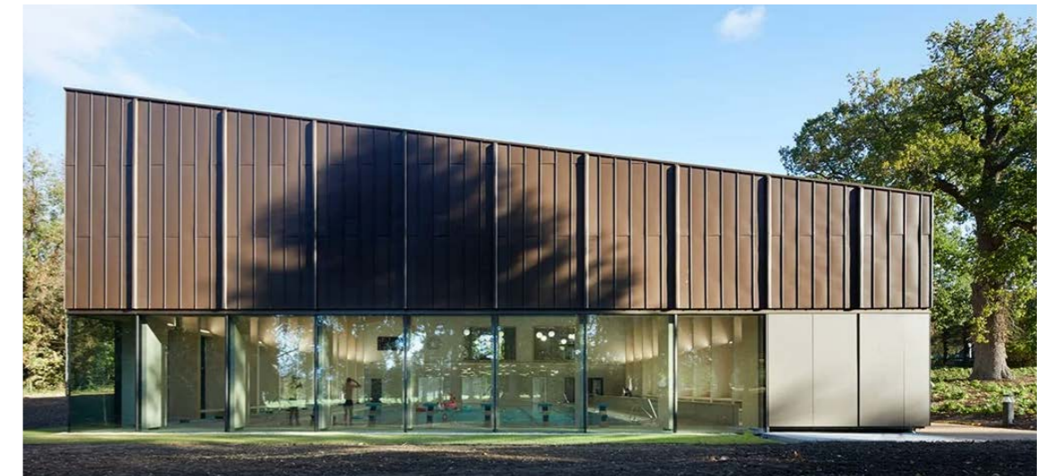
Voorbeeld licht hellend dak, sterke relatie met de omgeving en passende kleuren en materialen