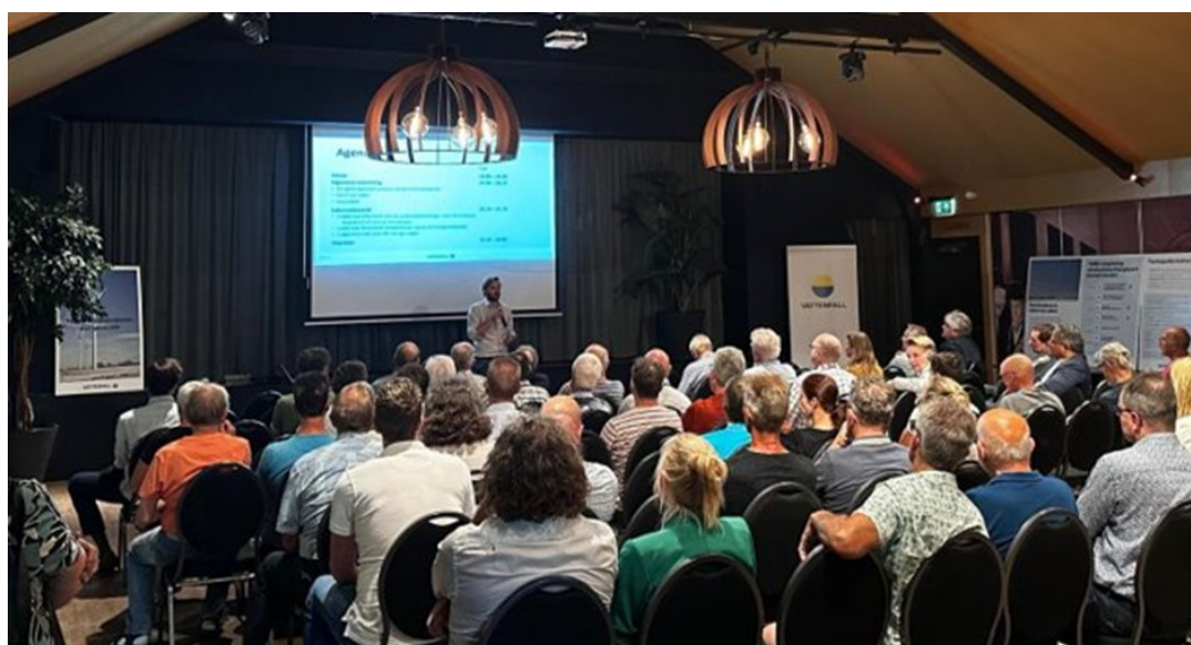
Foto 4. Tweede informatieavond