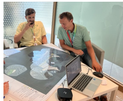
Foto 3. Eerste ontwerpplatform