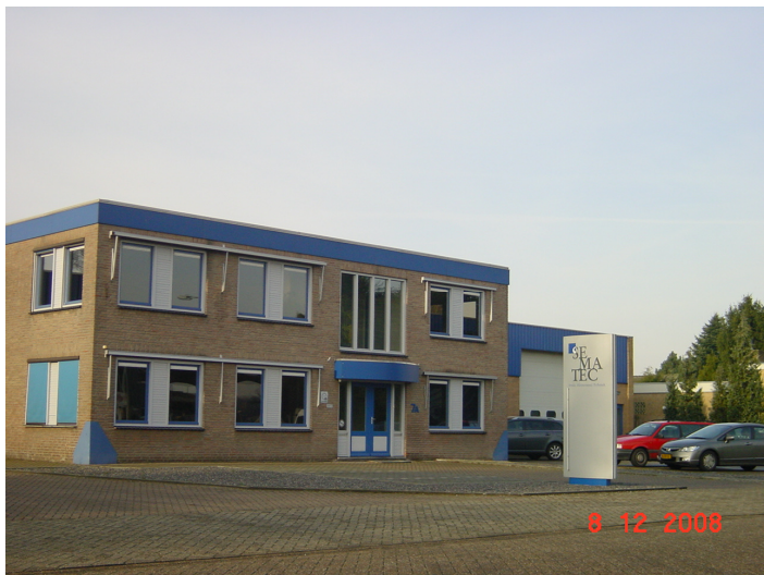
Vlaggenmasten en reclame zuilen zijn, mits wordt voldaan aan de gestelde criteria, toegestaan op industrieterreinen