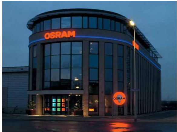
Reclames op industrieterreinen die voldoen aan de voorschriften