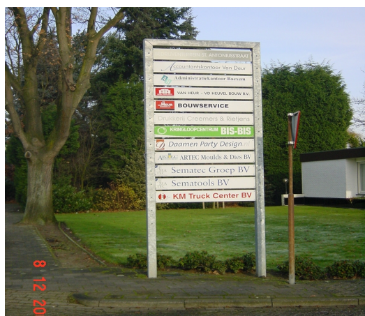
Uniforme verwijsborden aan de toegang van een industrieterrein zijn toegestaan