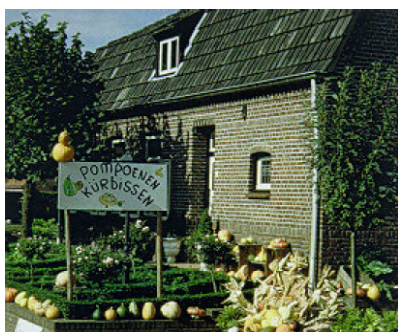
Tijdelijke reclame t.b.v. de verkoop van streekproducten is toegestaan