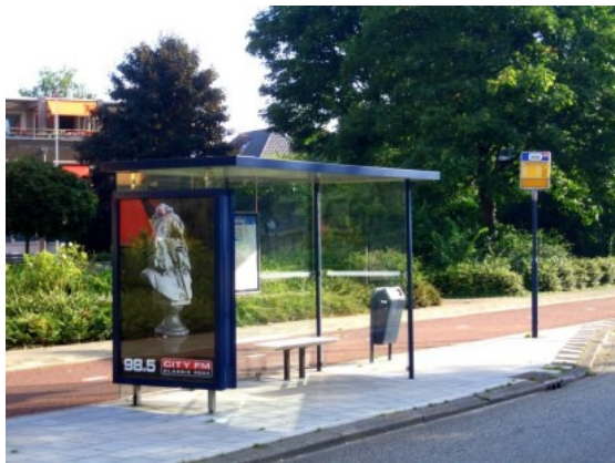
Reclame in abri's is overal toegestaan