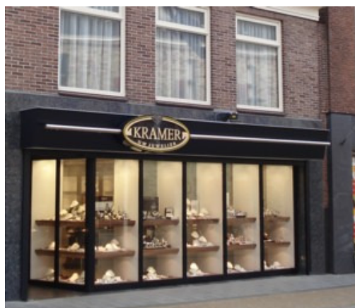
Acceptabele reclame in centrumgebied. De reclame is in evenwicht met de vormgeving van het pand