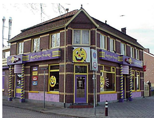
Onacceptabele reclame in het centrumgebied. De hoeveelheid, vormgeving en kleurstelling tast de vormgeving van het pand negatief aan.