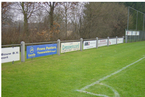
Reclame gericht naar het veld is toegestaan