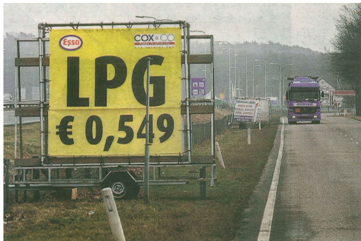
Door verwijfsreclame langs wegen ontstaat een zware aantasting van het ruimtelijke beeld