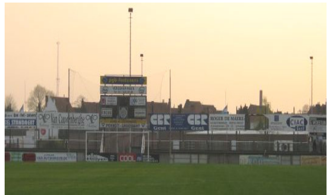
Een overdaad aan reclame is niet toegestaan