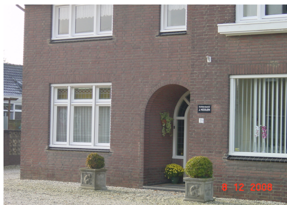
Eén klein reclamebord voor het uitoefenen van een beroep aan huis is toegestaan

Kleinschalige reclame kan worden toegestaan. Voorkomen moet worden dat het woonkarakter van het gebied van de bebouwde kom wordt aangetast door te veel aan reclame. De concrete voorschriften waaraan de reclame dient te voldoen is aangegeven in bijlage 1. Indien de reclame aan deze criteria voldoet, wordt de reclame geacht vergunningsvrij te zijn.