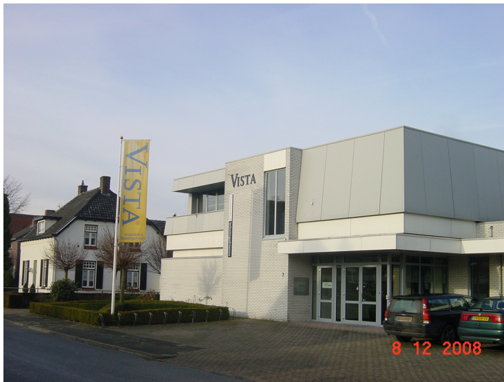
Reclame bij een bedrijf in de woonomgeving welke voldoet aan de voorschriften