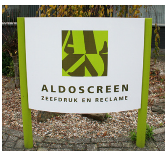
één vrijstaand reclamebord per bedrijfsbestemming in het buitengebied is toegestaan.