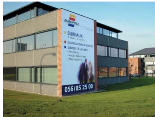
Door teveel en te grote (onsamenhangende) reclame wordt het pand zowel op zichzelf als in de (woon)omgeving aangetast